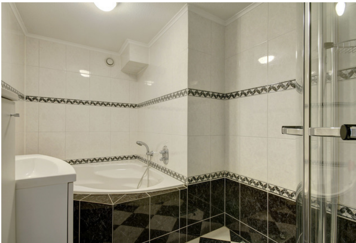
Pieter Calandlaan 700, 1060TW AMSTERDAM