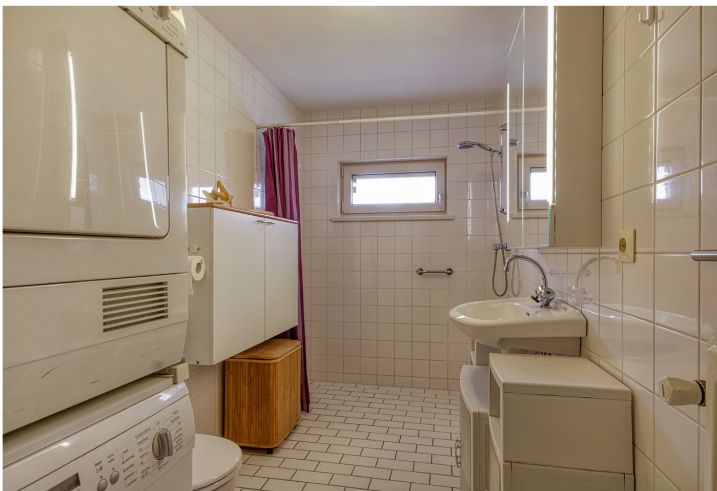
Marmolada 18, 1060 PG AMSTERDAM