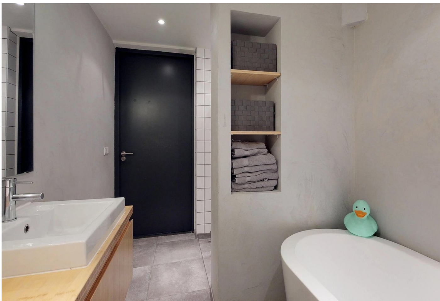
Chassestraat 11huis, 1057 HV AMSTERDAM