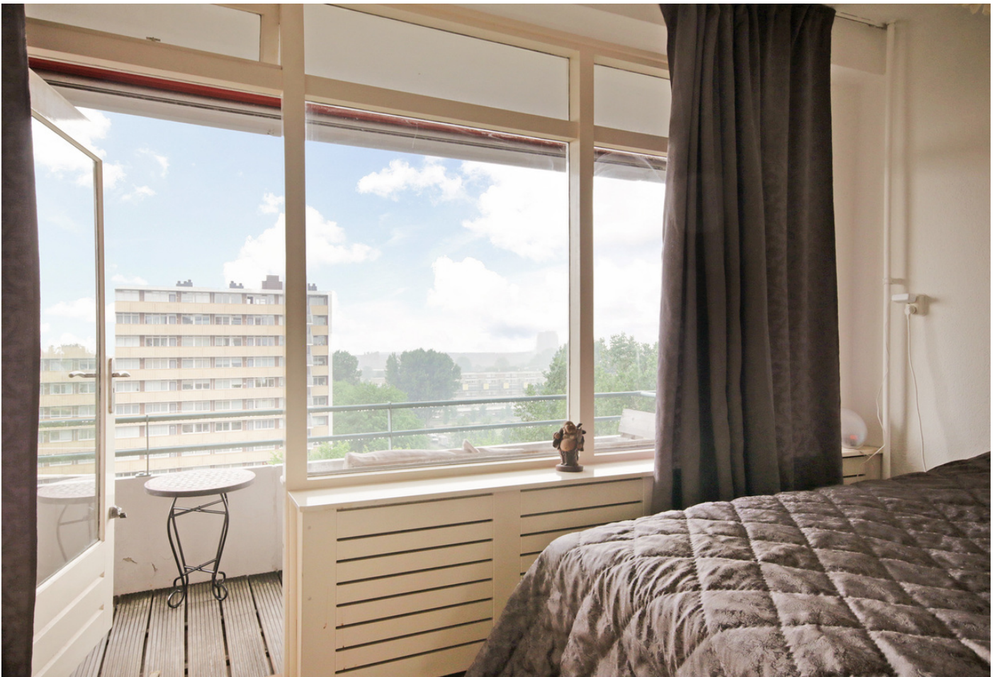
Langswater 764, 1069 EG AMSTERDAM