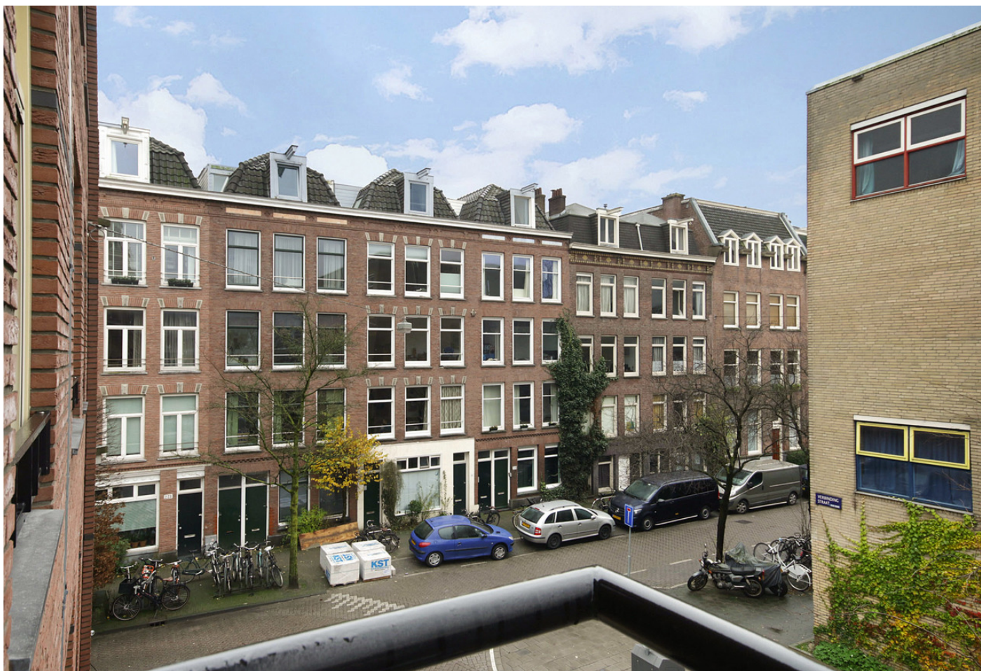
Kuipersstraat 171, 1073 ER AMSTERDAM