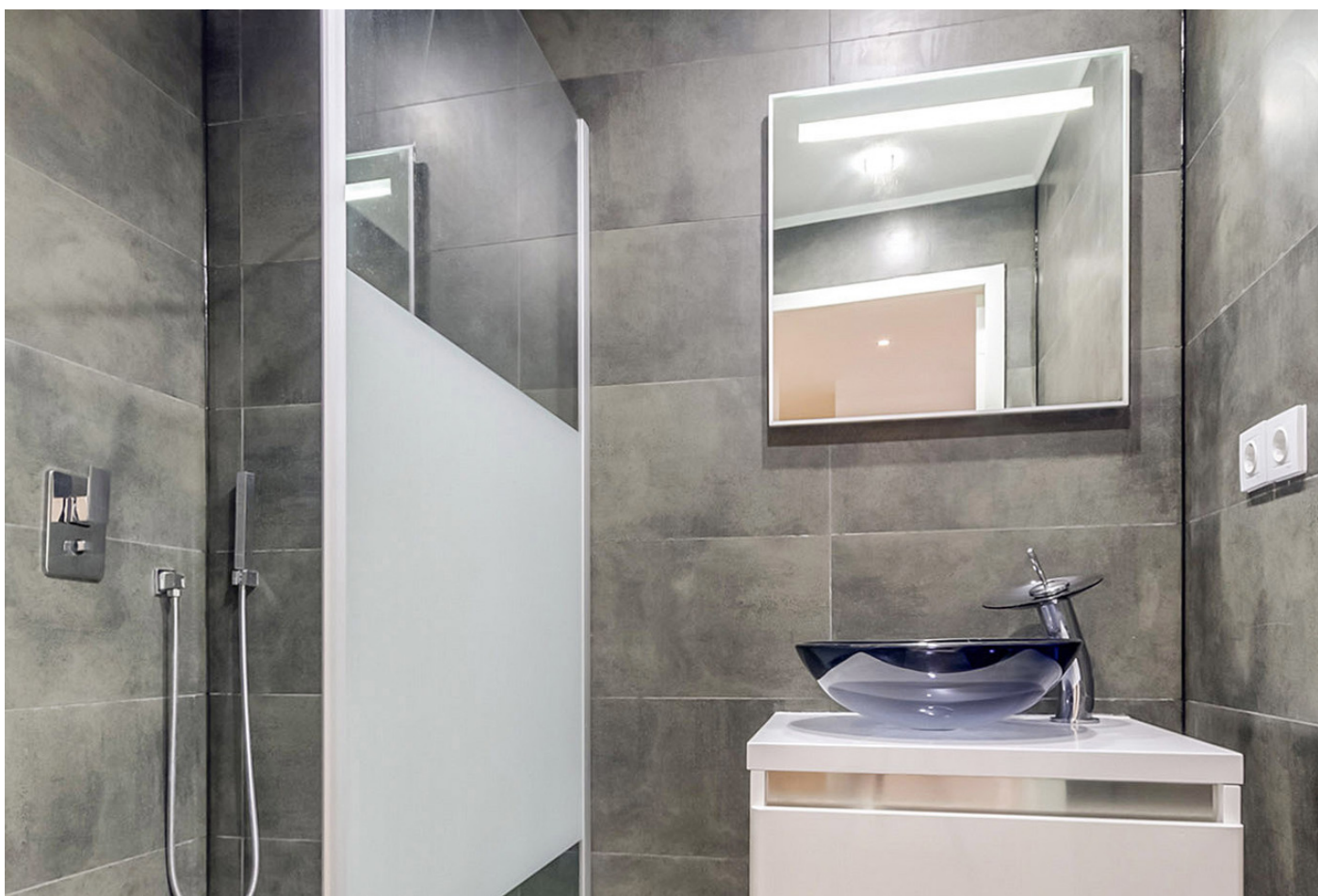
Gibraltarstraat 82huis, 1055 NT AMSTERDAM