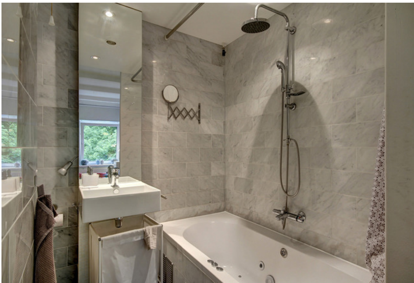
President Kennedylaan 184II, 1079 NN AMSTERDAM