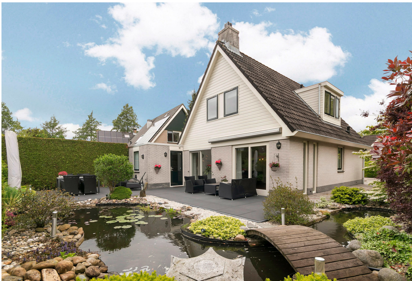
Zuiderhout 54, 1695 AW BLOKKER