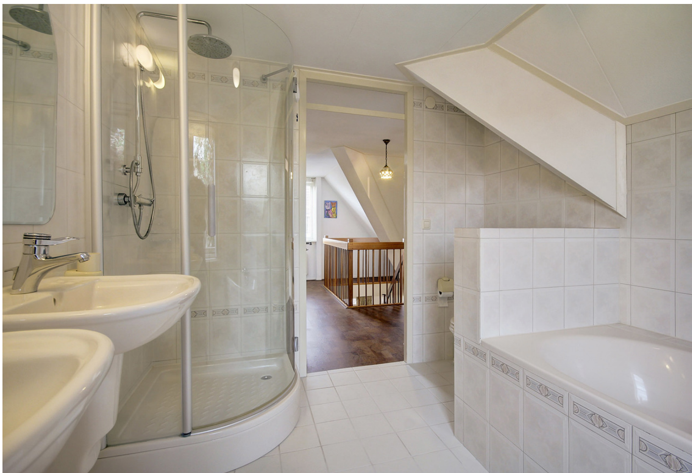
West Weer 22, 1151 GB BROEK IN WATERLAND