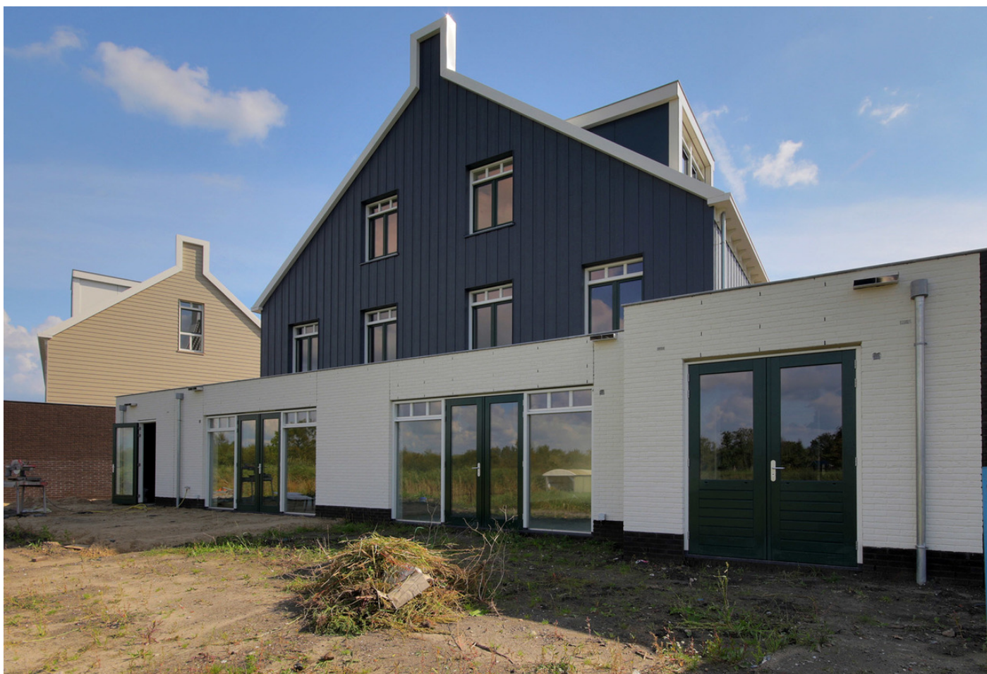
Spoetnikstraat 33, 1511 DG OOSTZAAN