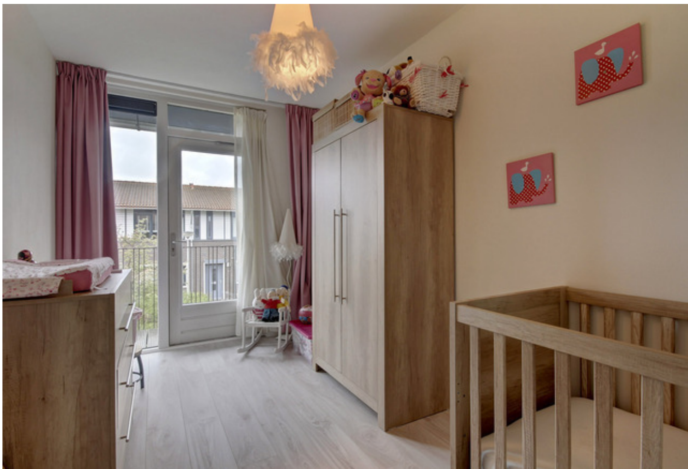
Piramidepad 11, 1448 NS PURMEREND