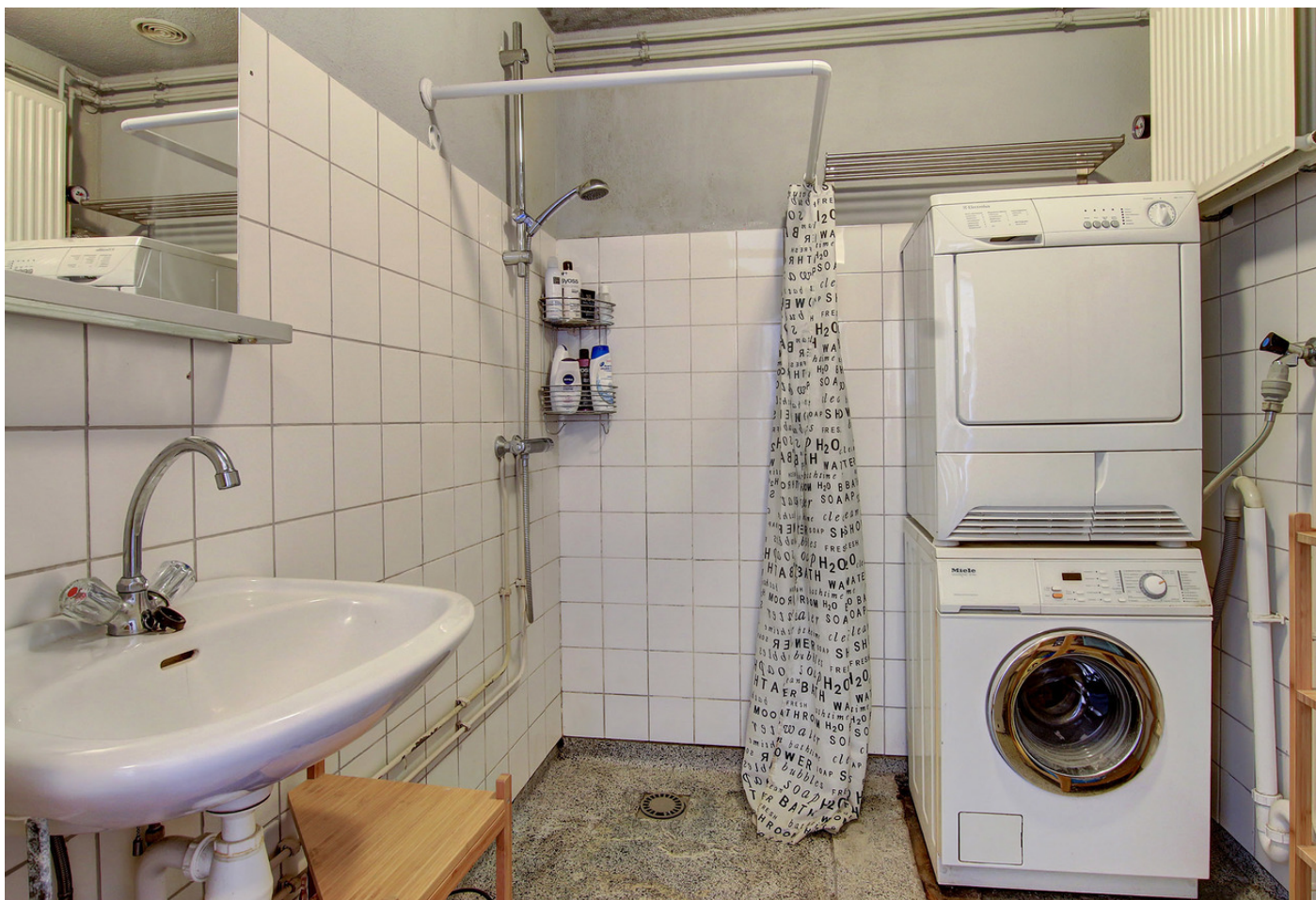
Olof Palmeplein 22, 1025 WS AMSTERDAM