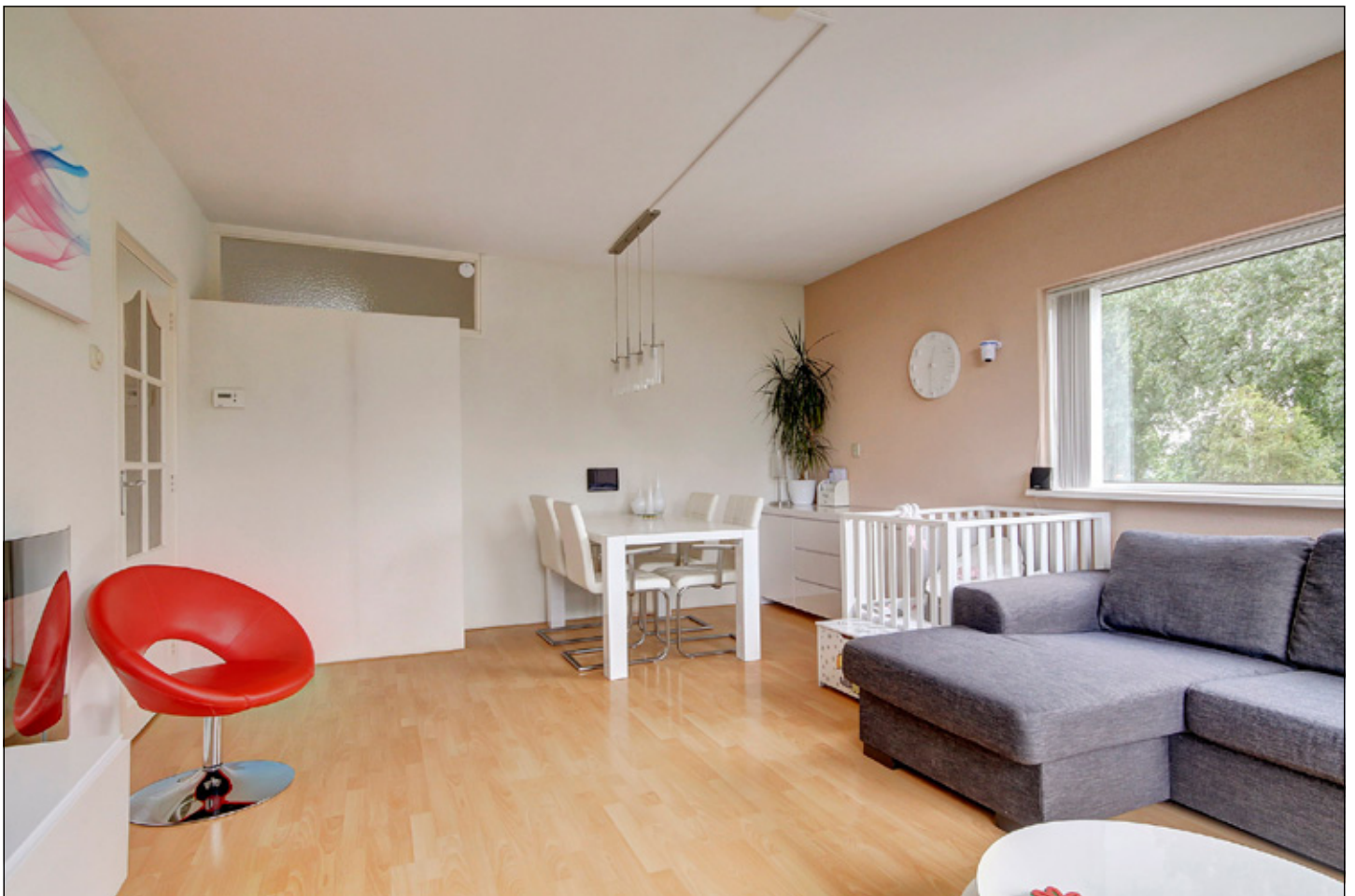
extra lichtinval door de hoekligging