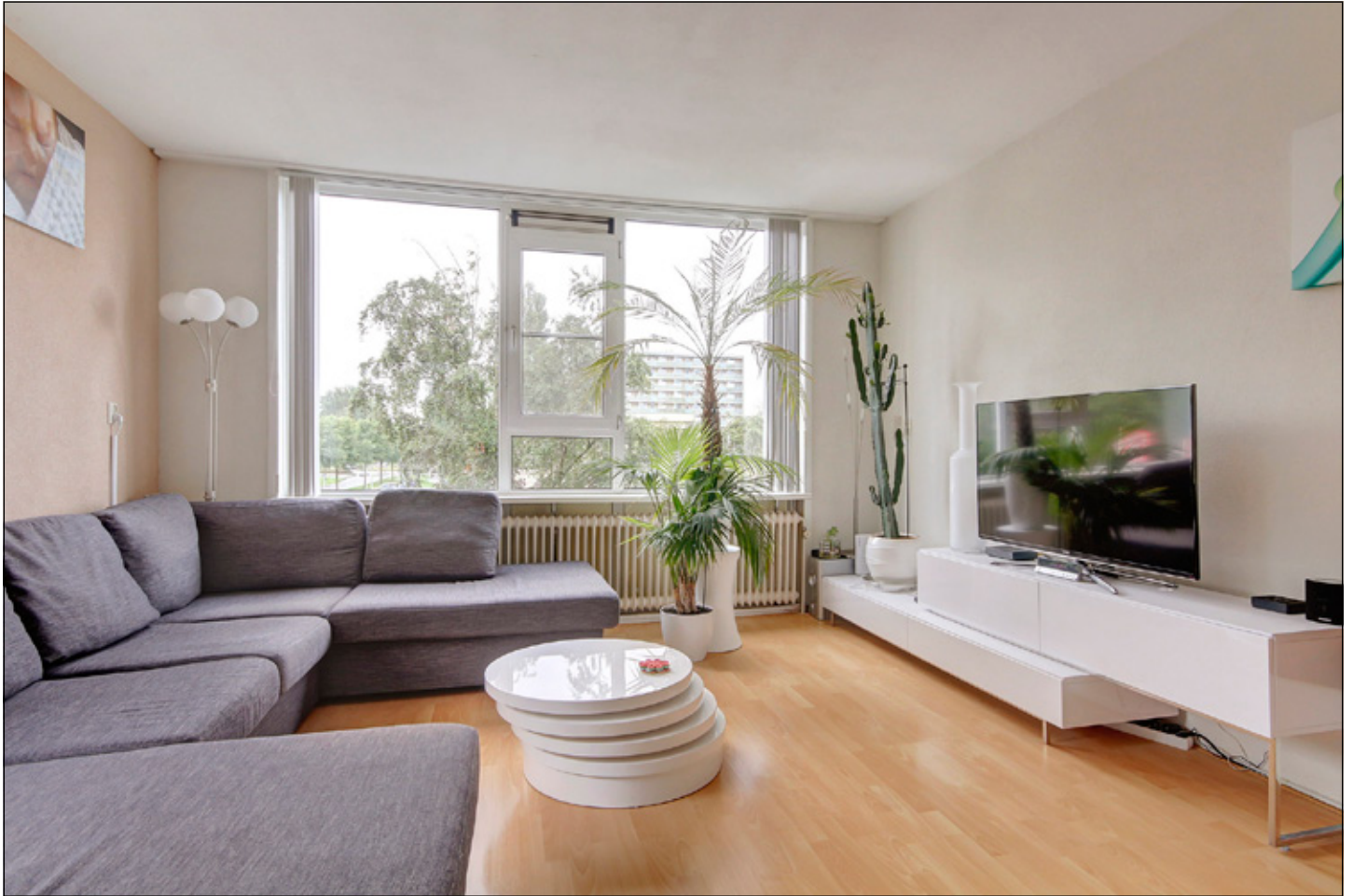
ruime en lichte woonkamer