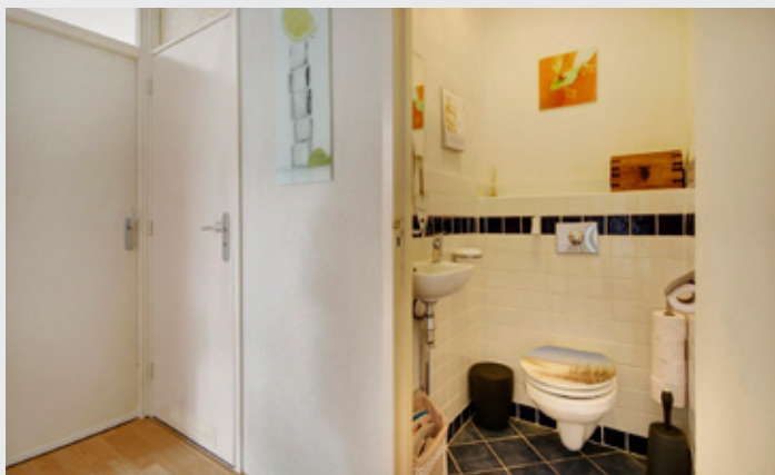
toilet en hal