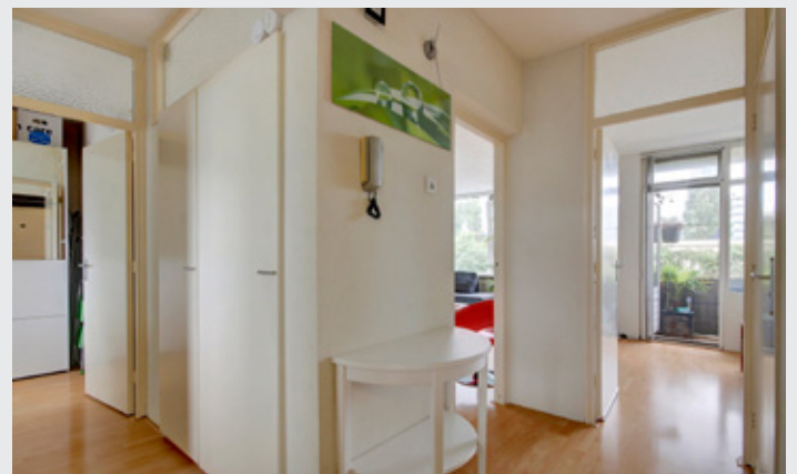
overzicht vanuit hal