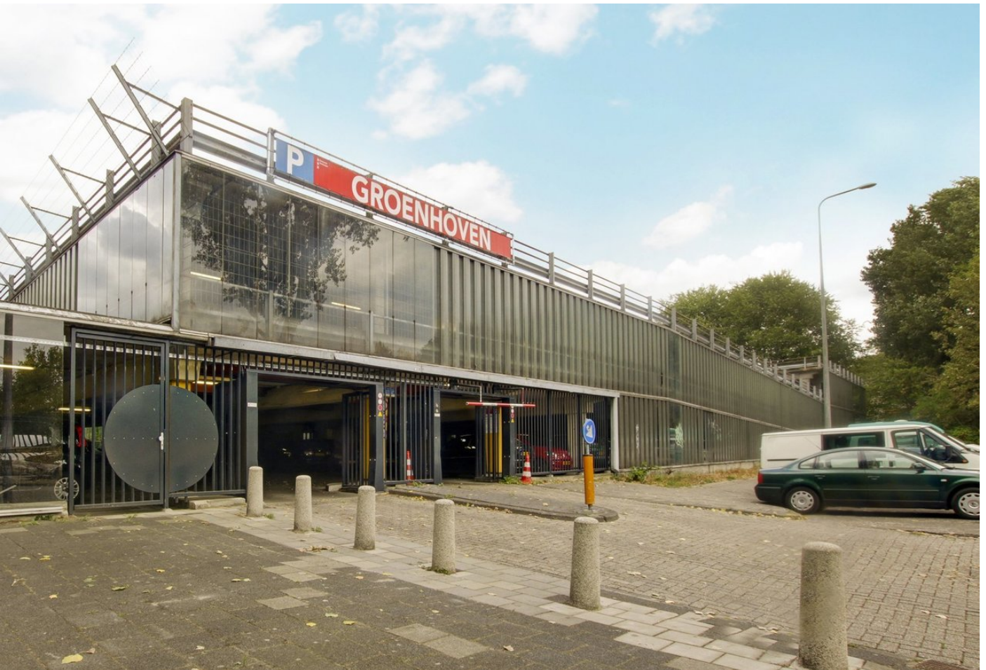
Groenhoven 847, 1103 NB AMSTERDAM