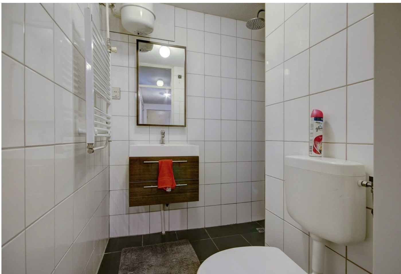
Dolingadreef 201, 1102 WT AMSTERDAM