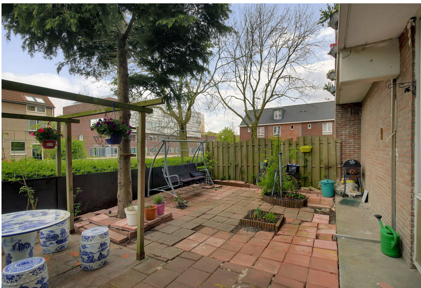
Corversbosstraat 99, 1024 KK AMSTERDAM