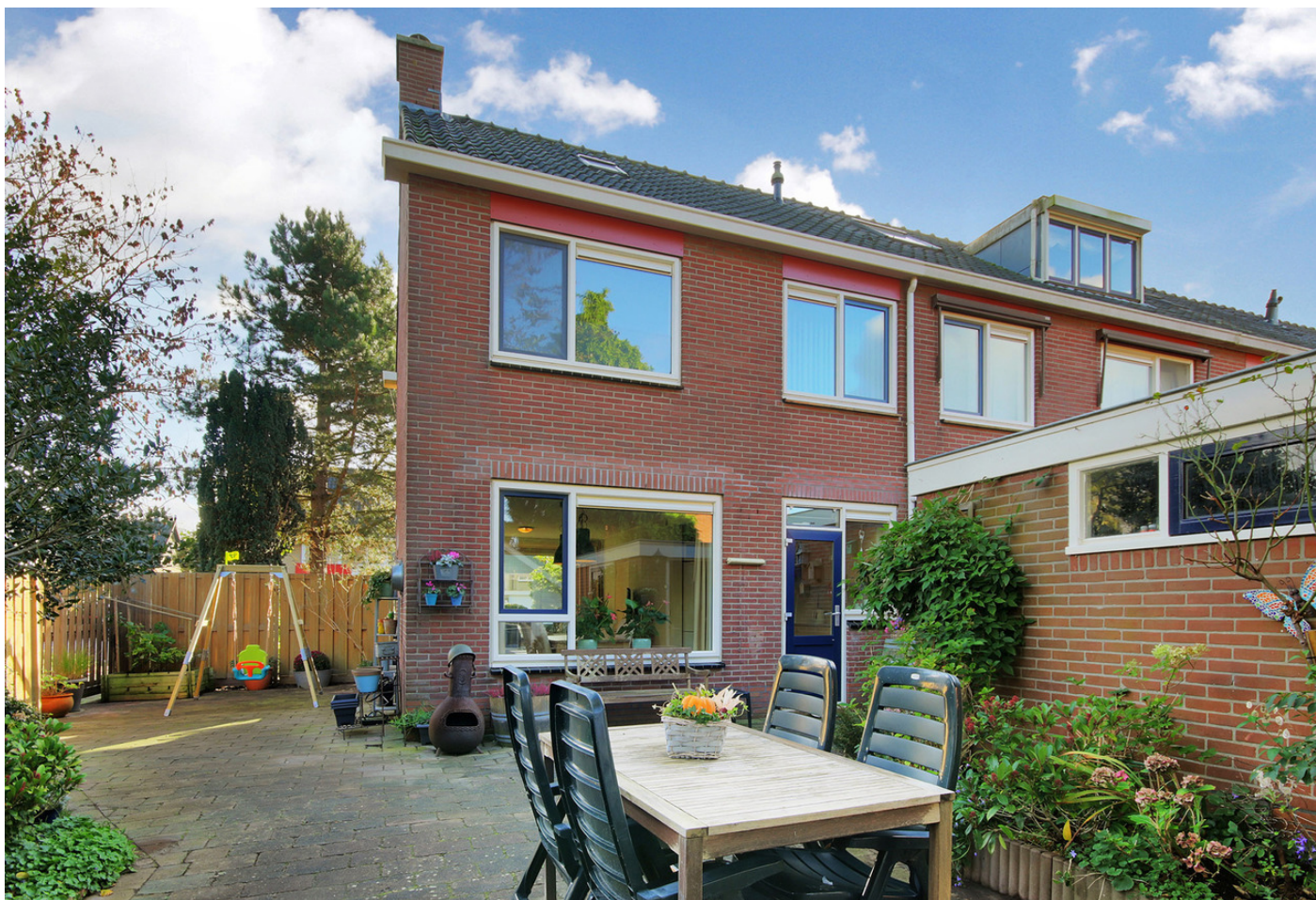
Cornelis Dirkszoonlaan 33, 1141 XW MONNICKENDAM