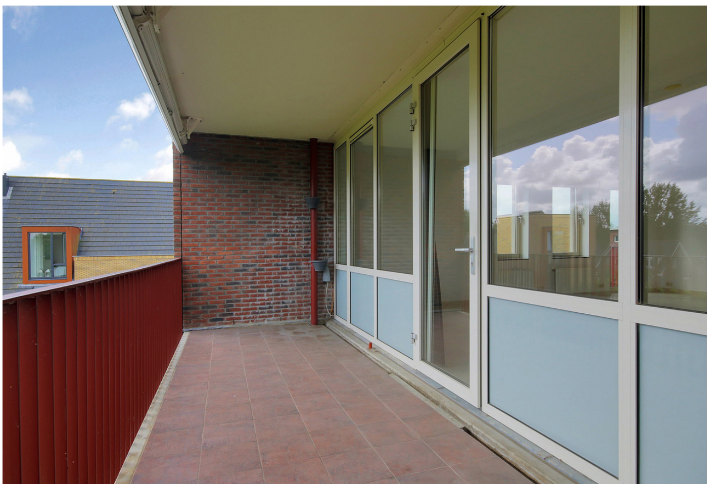
San Marco 44, 2134 AK HOOFDDORP