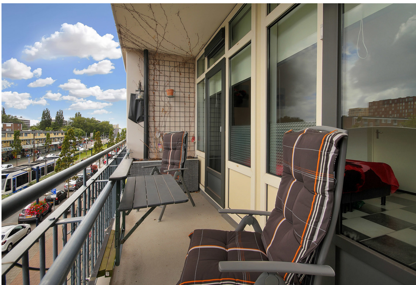
Tussen Meer 14II, 1068 GA AMSTERDAM