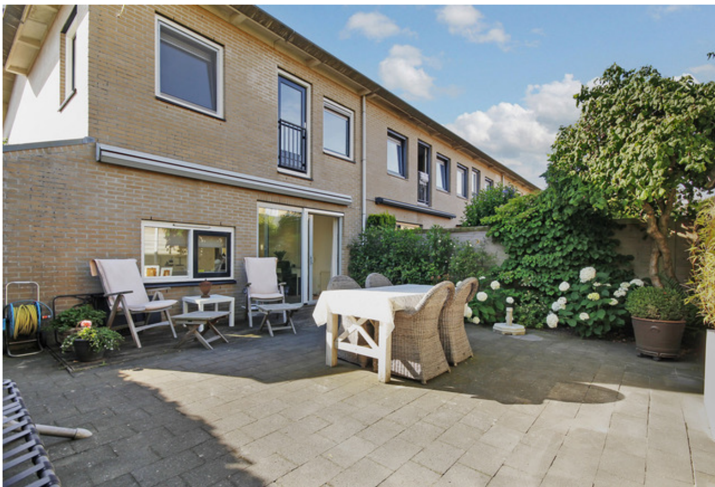
La Meye 66, 1060 NS AMSTERDAM