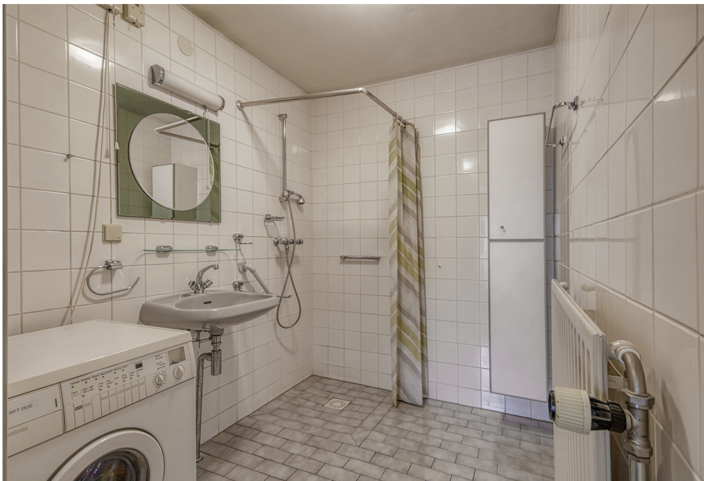
Wittgensteinlaan 199, 1062 KE AMSTERDAM