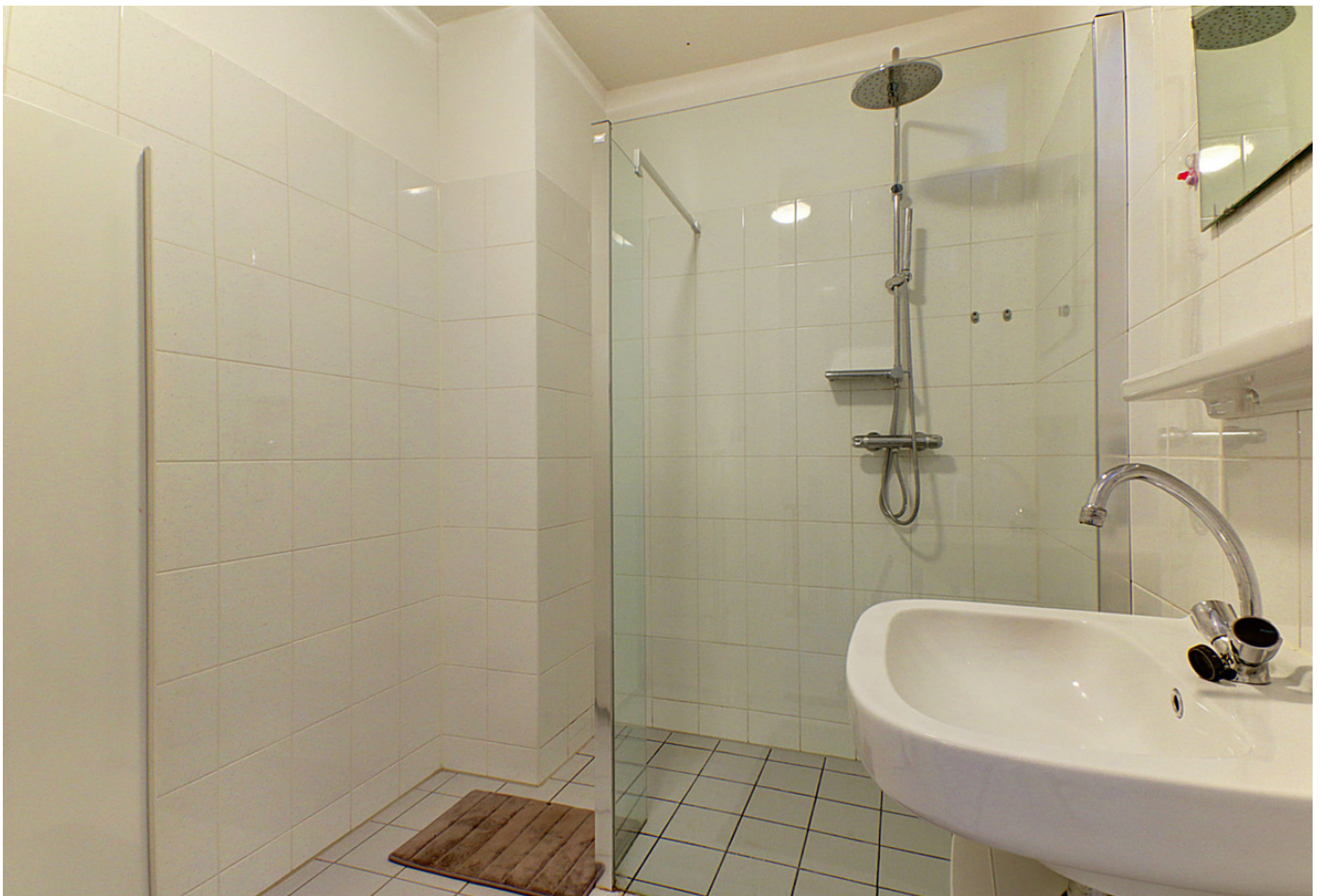
Johan Hofmanstraat 273, 1069 KD AMSTERDAM