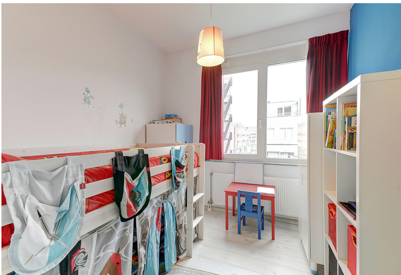
Johan Hofmanstraat 273, 1069 KD AMSTERDAM