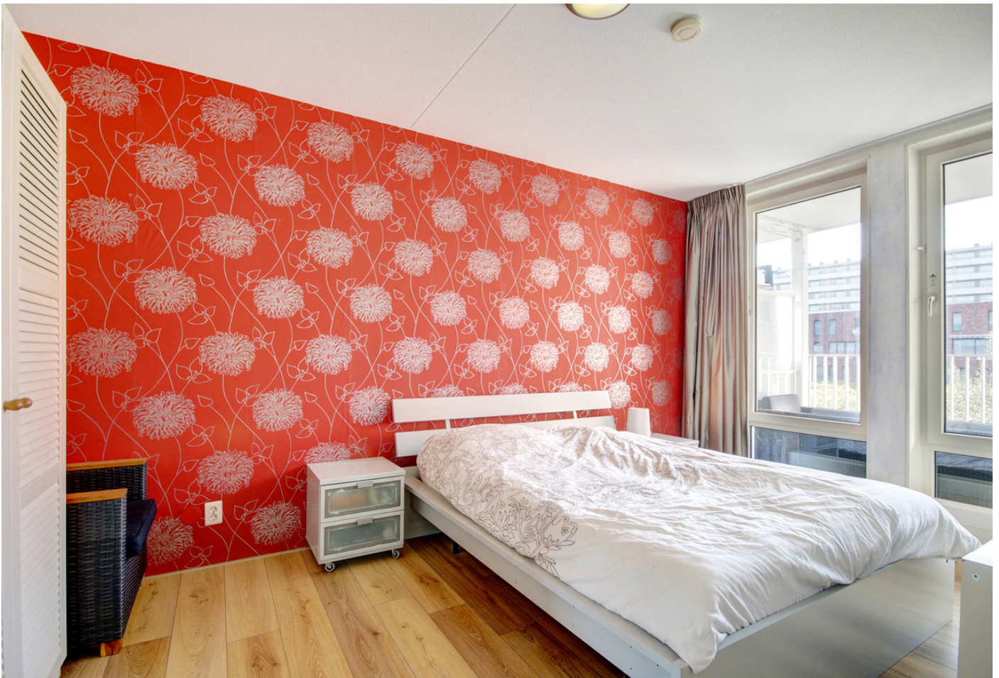
Meer en Vaart 138B, 1068 ZZ AMSTERDAM