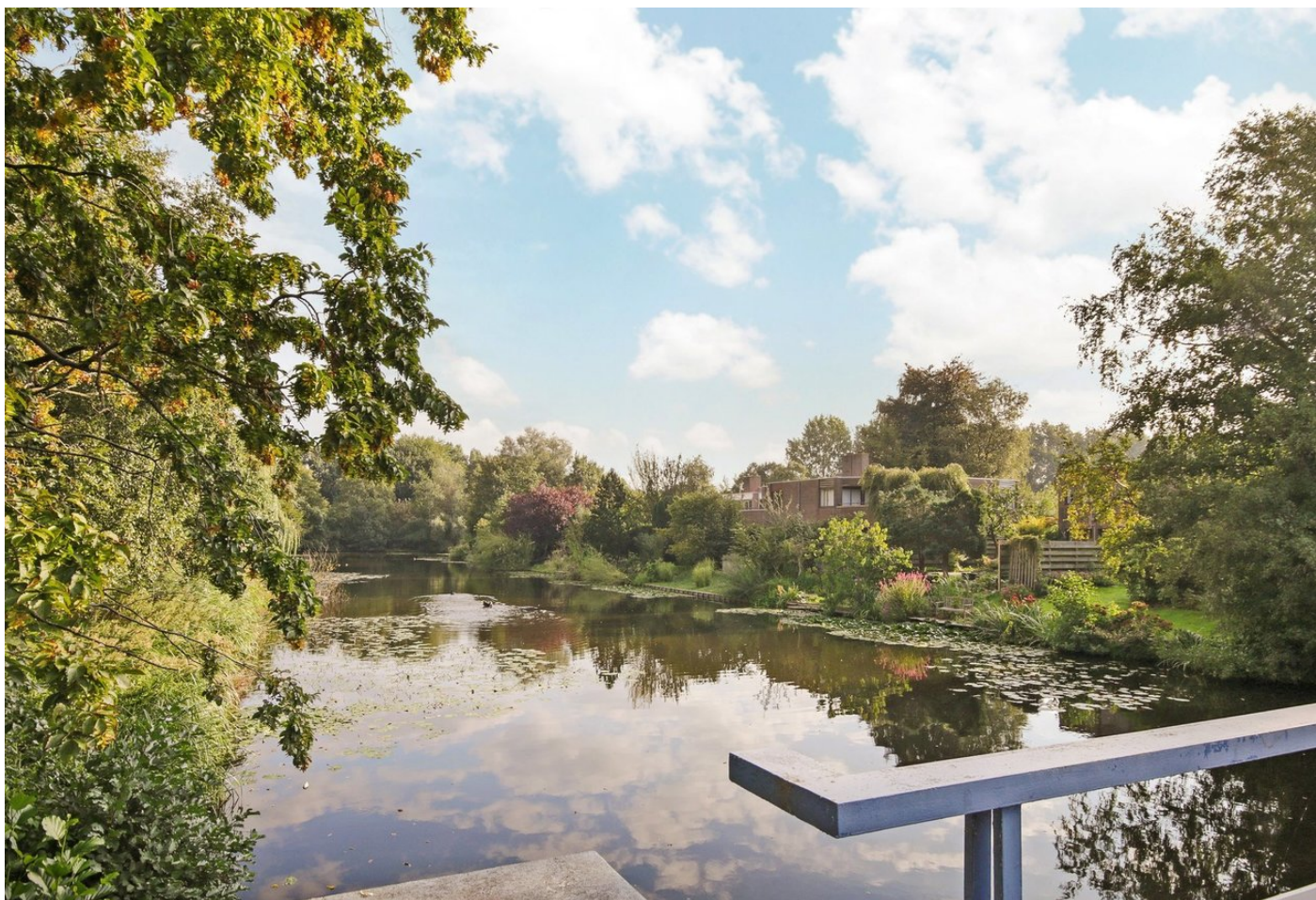
Jisperveldstraat 465, 1024 AX AMSTERDAM