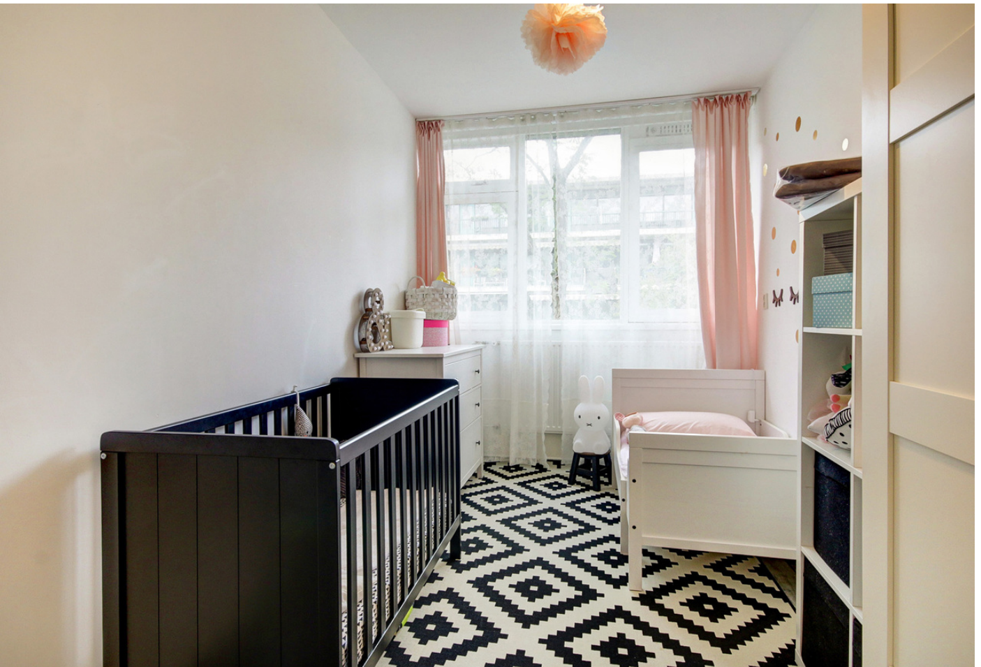
Spinaker 9, 1034 MD AMSTERDAM