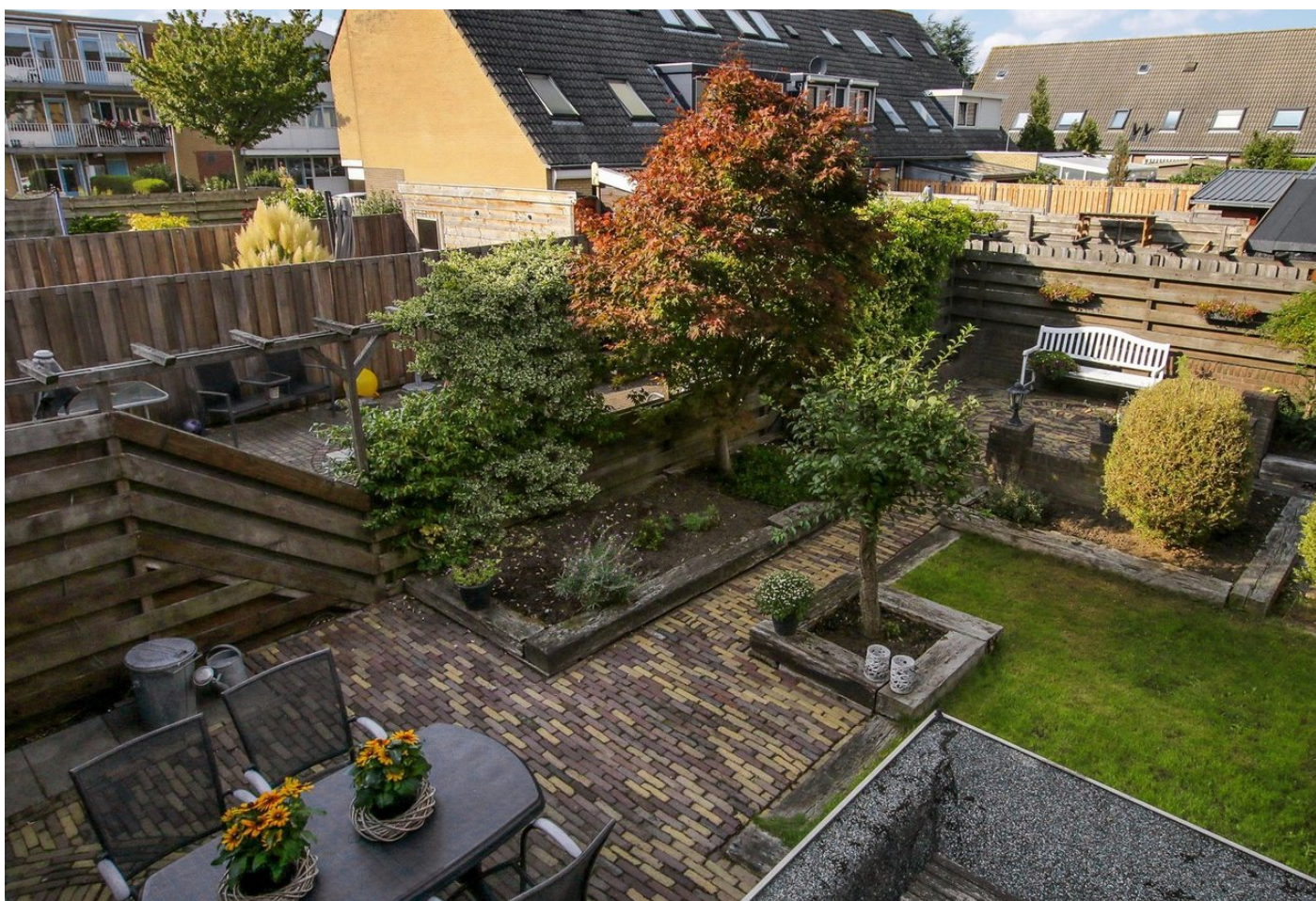
Naardermeer 112, 1447 KN PURMEREND