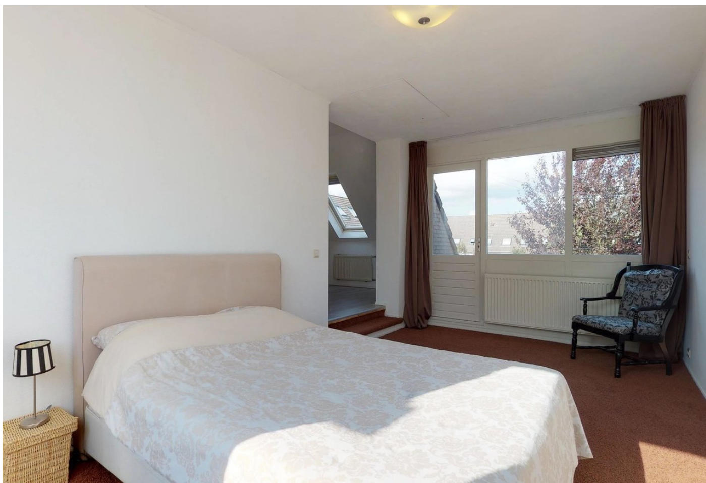
Naardermeer 112, 1447 KN PURMEREND