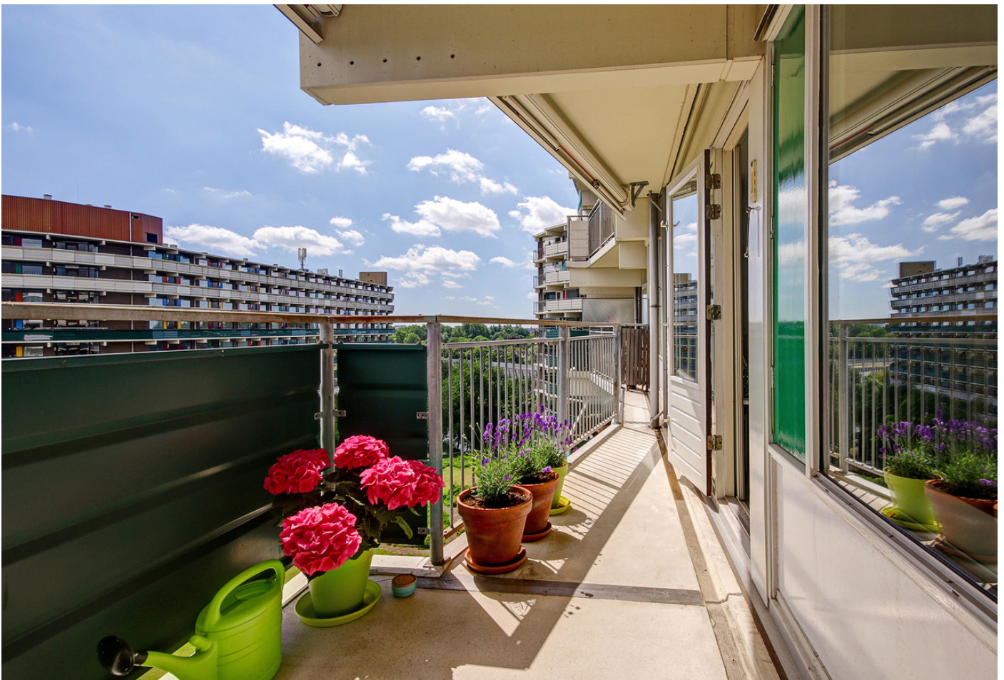
Loenermark 218+PP, 1025 SV AMSTERDAM