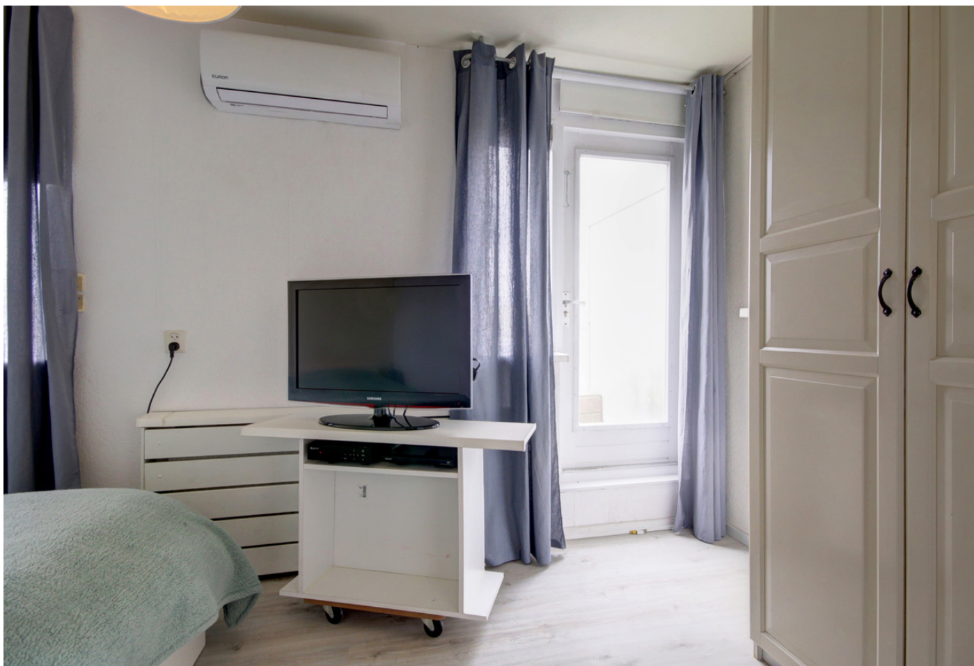
Sandwijk 50, 1035 LC AMSTERDAM