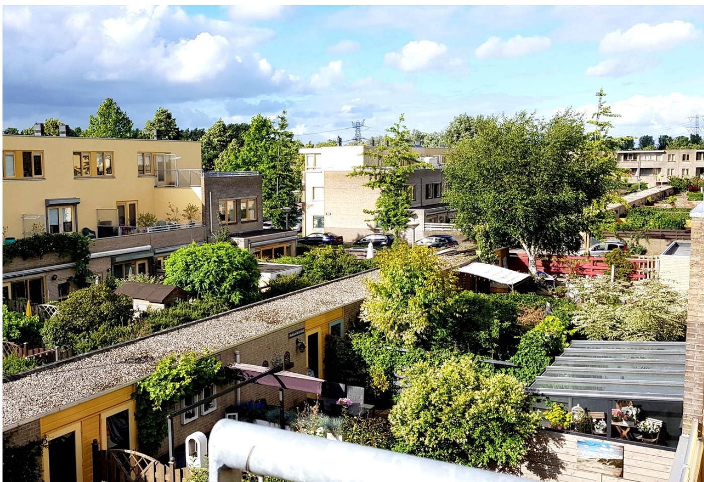
Sandwijk 50, 1035 LC AMSTERDAM