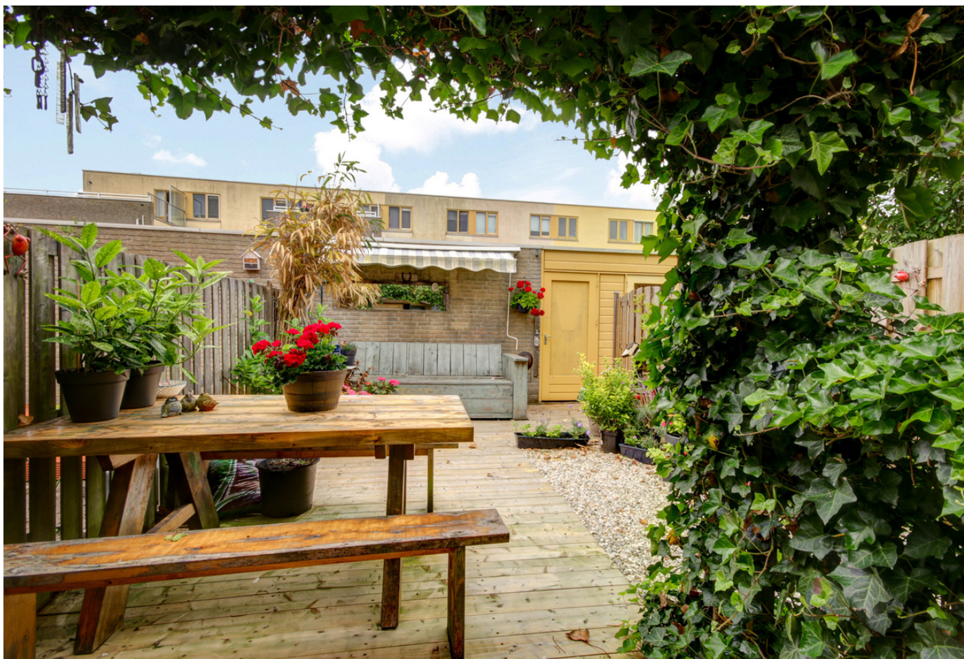
Sandwijk 50, 1035 LC AMSTERDAM