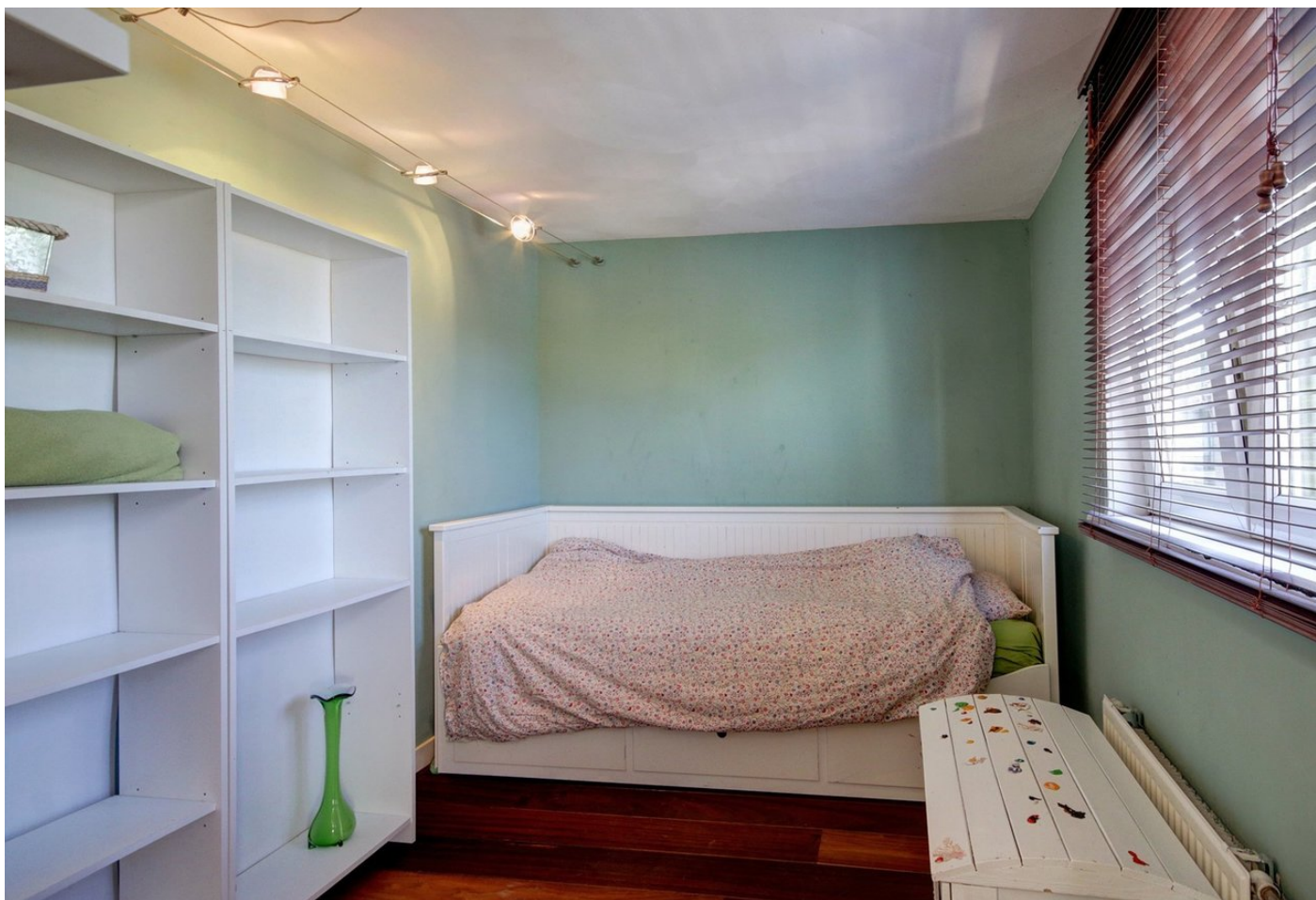
Makassarstraat 52III, 1095TA AMSTERDAM