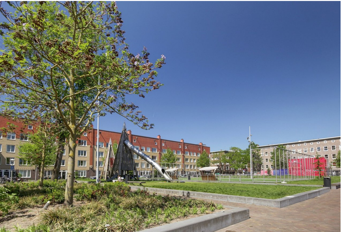
Makassarstraat 52III, 1095TA AMSTERDAM