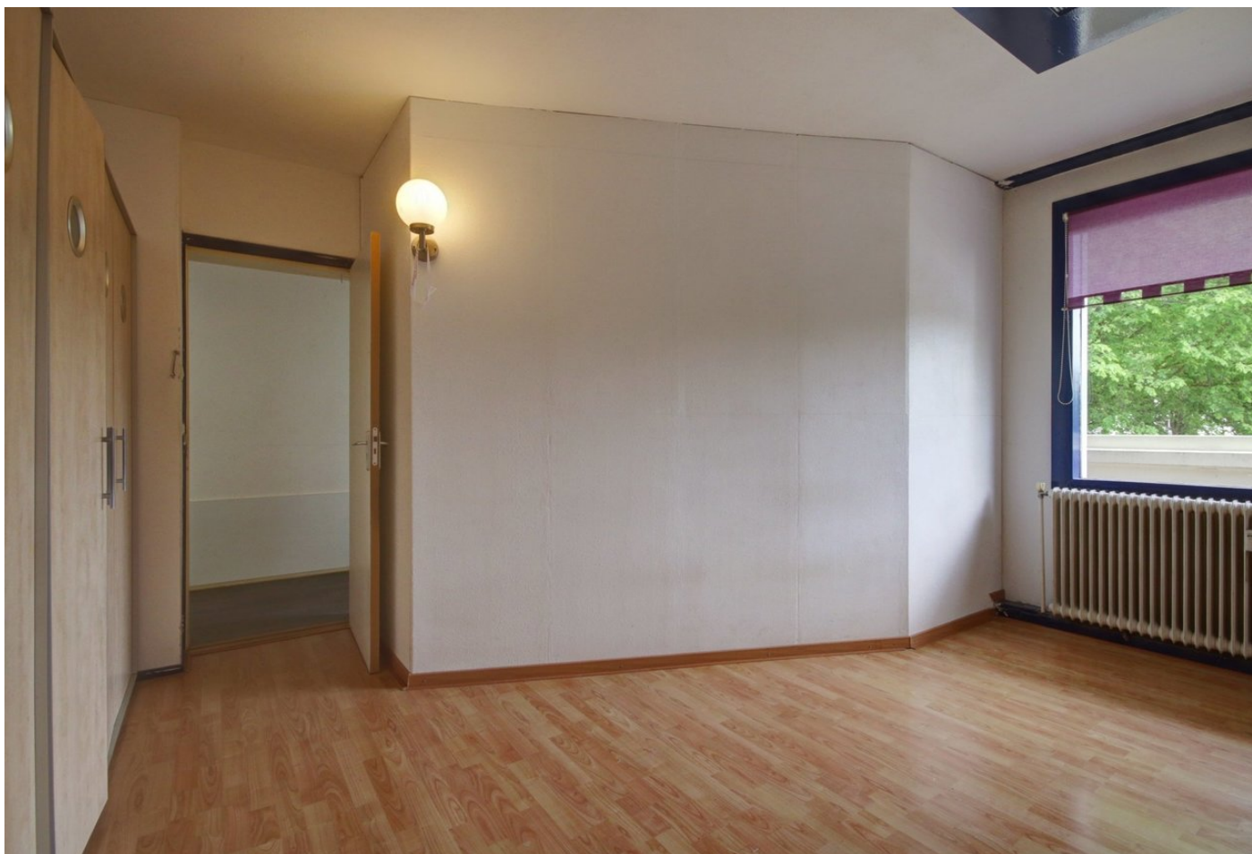
Jisperveldstraat 118, 1024 AE AMSTERDAM