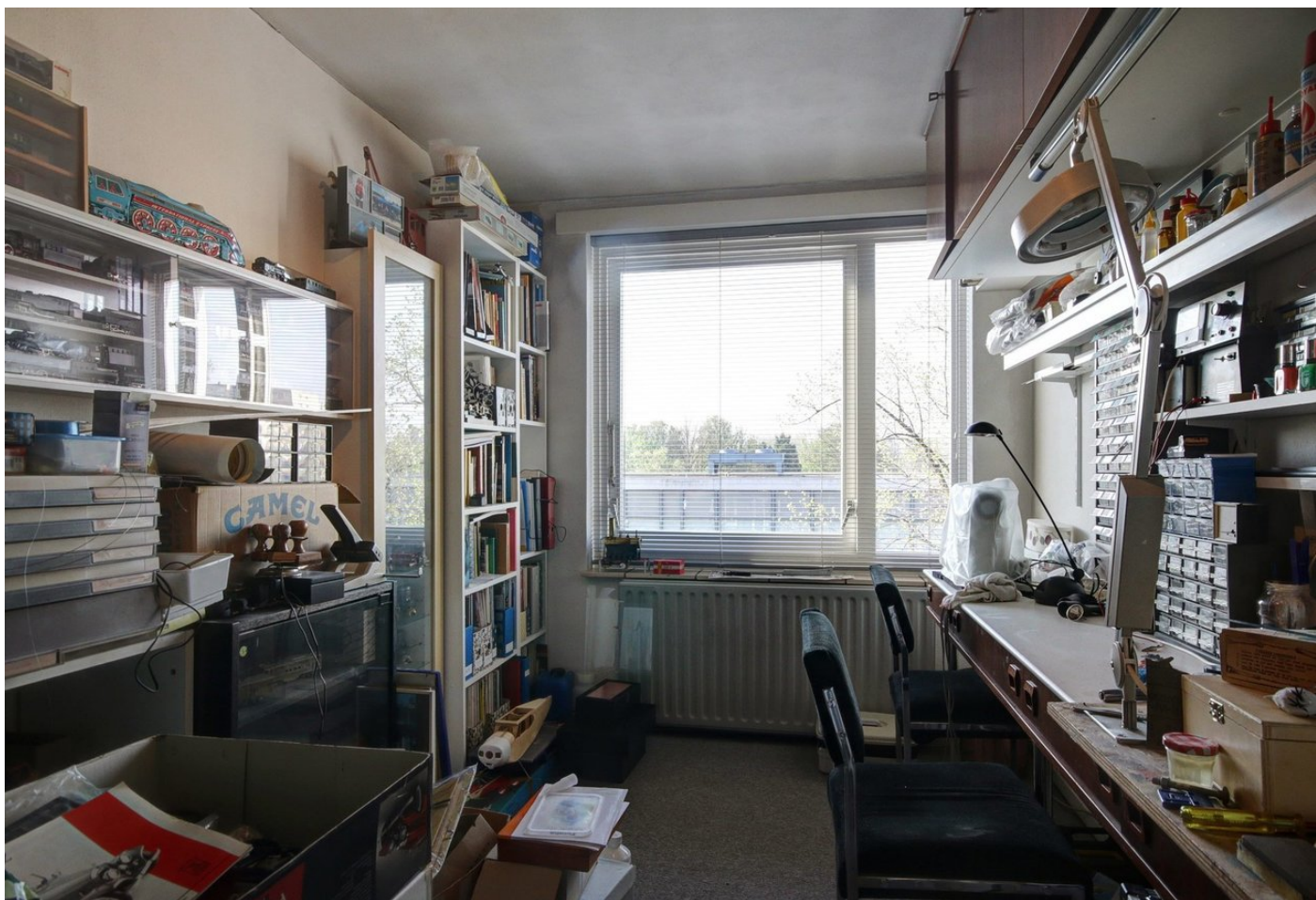
Pieter Calandlaan 49, 1065 KJ AMSTERDAM