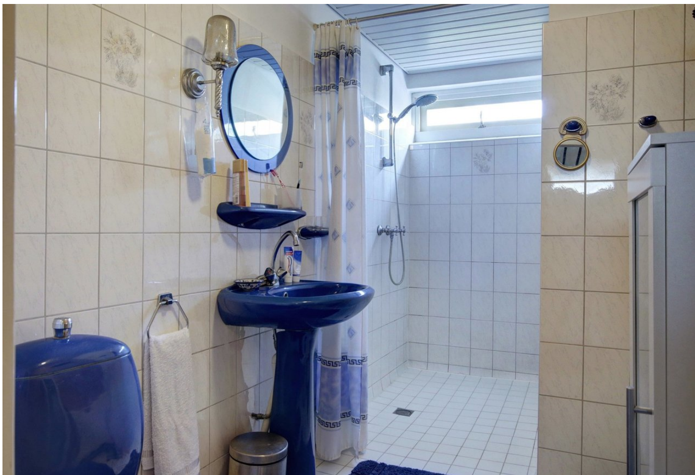
Pieter Calandlaan 49, 1065 KJ AMSTERDAM