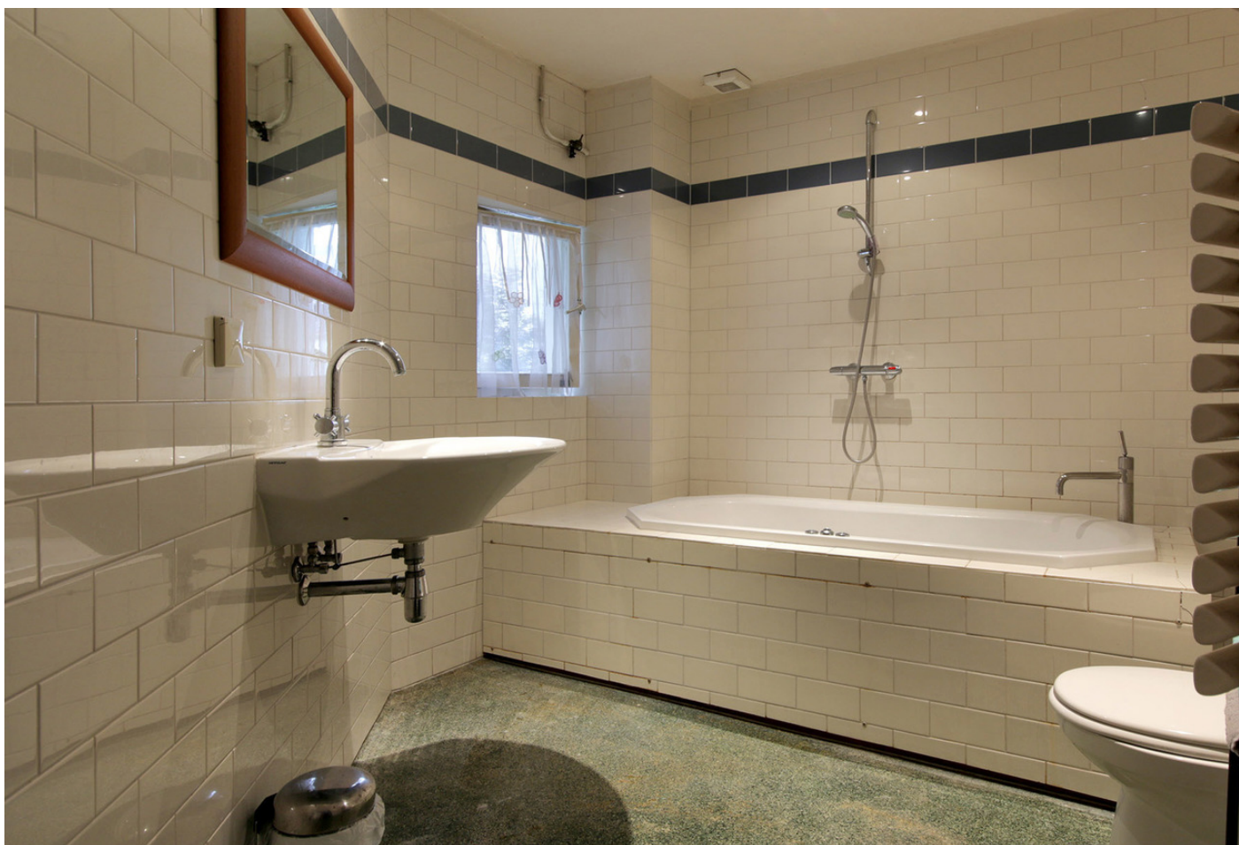
Prins Hendrikkade 151A, 1011 AV AMSTERDAM