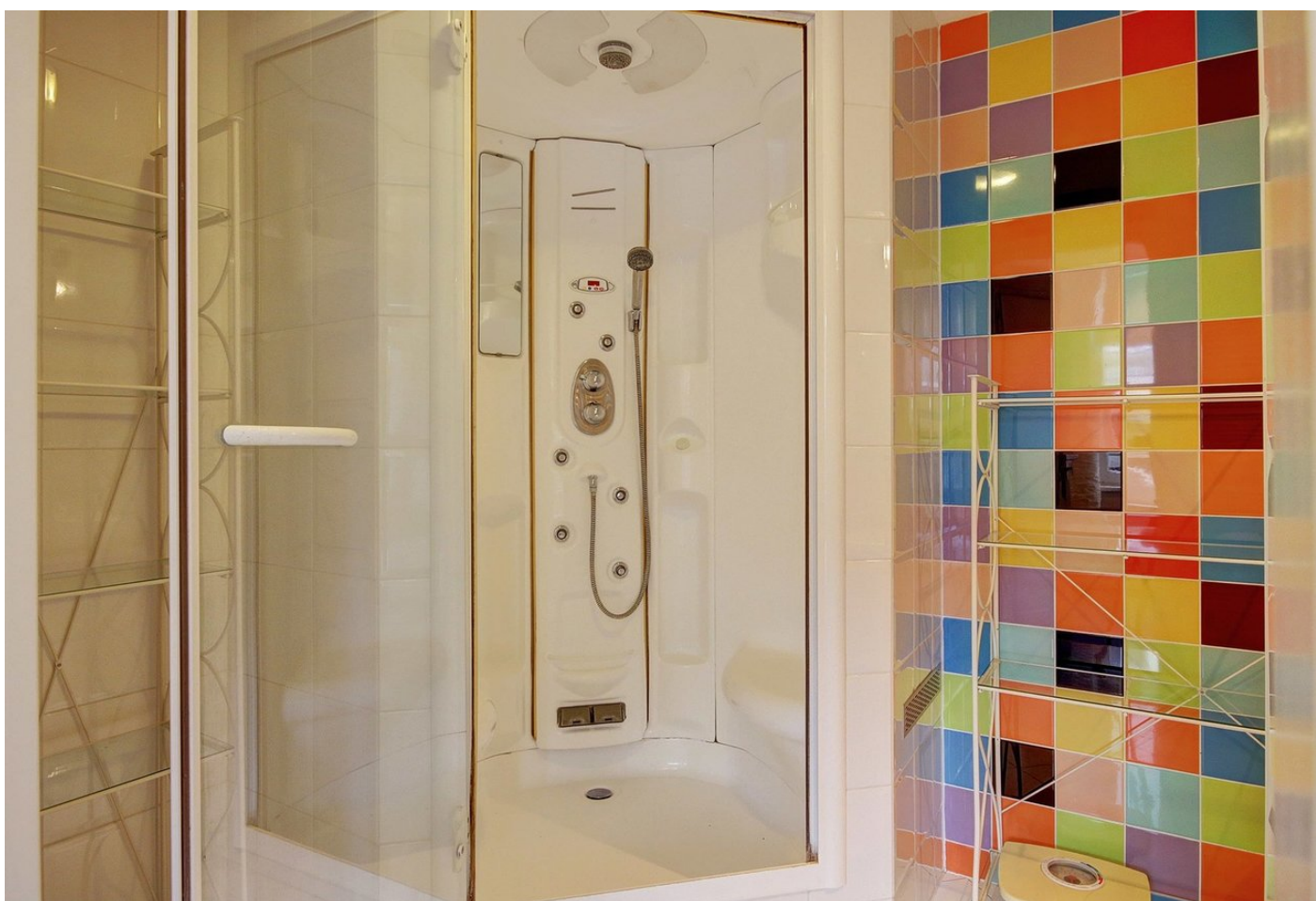
Mennonietenbuurt 42, 1427 AZ AMSTELHOEK