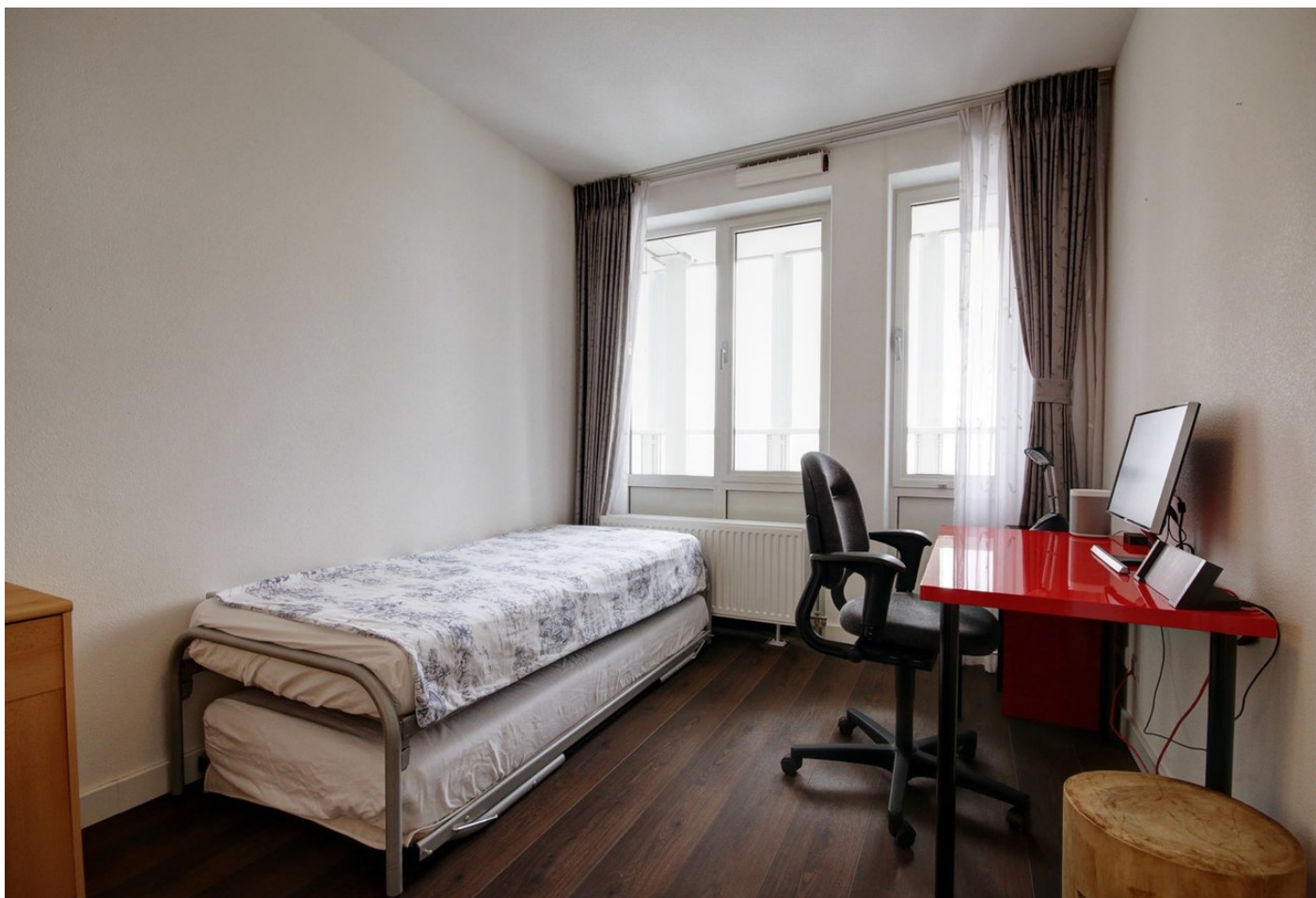
Willem Augustinstraat 214, 1061 MJ AMSTERDAM