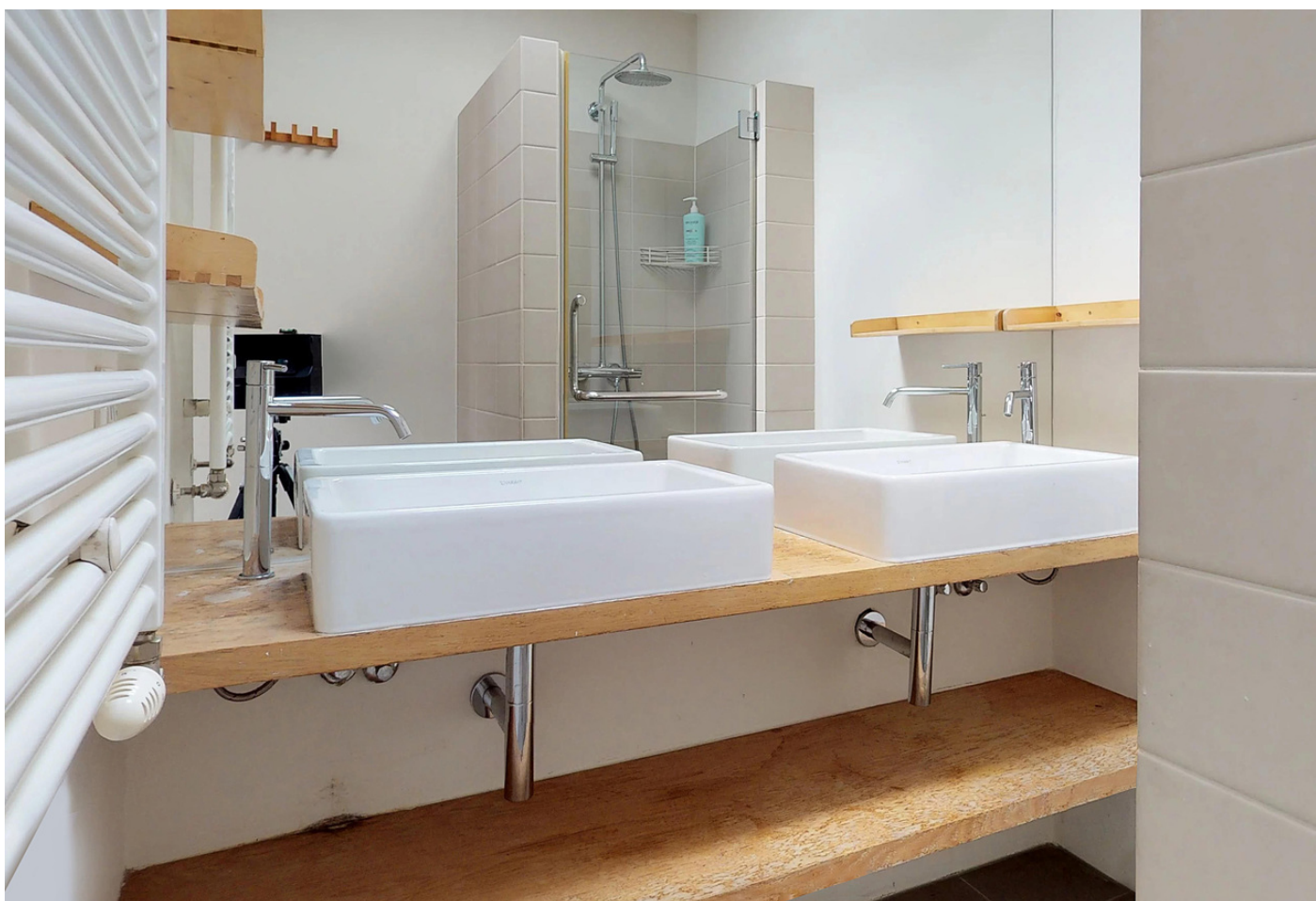
Nieuwendammerdijk 9, 1025 LC AMSTERDAM