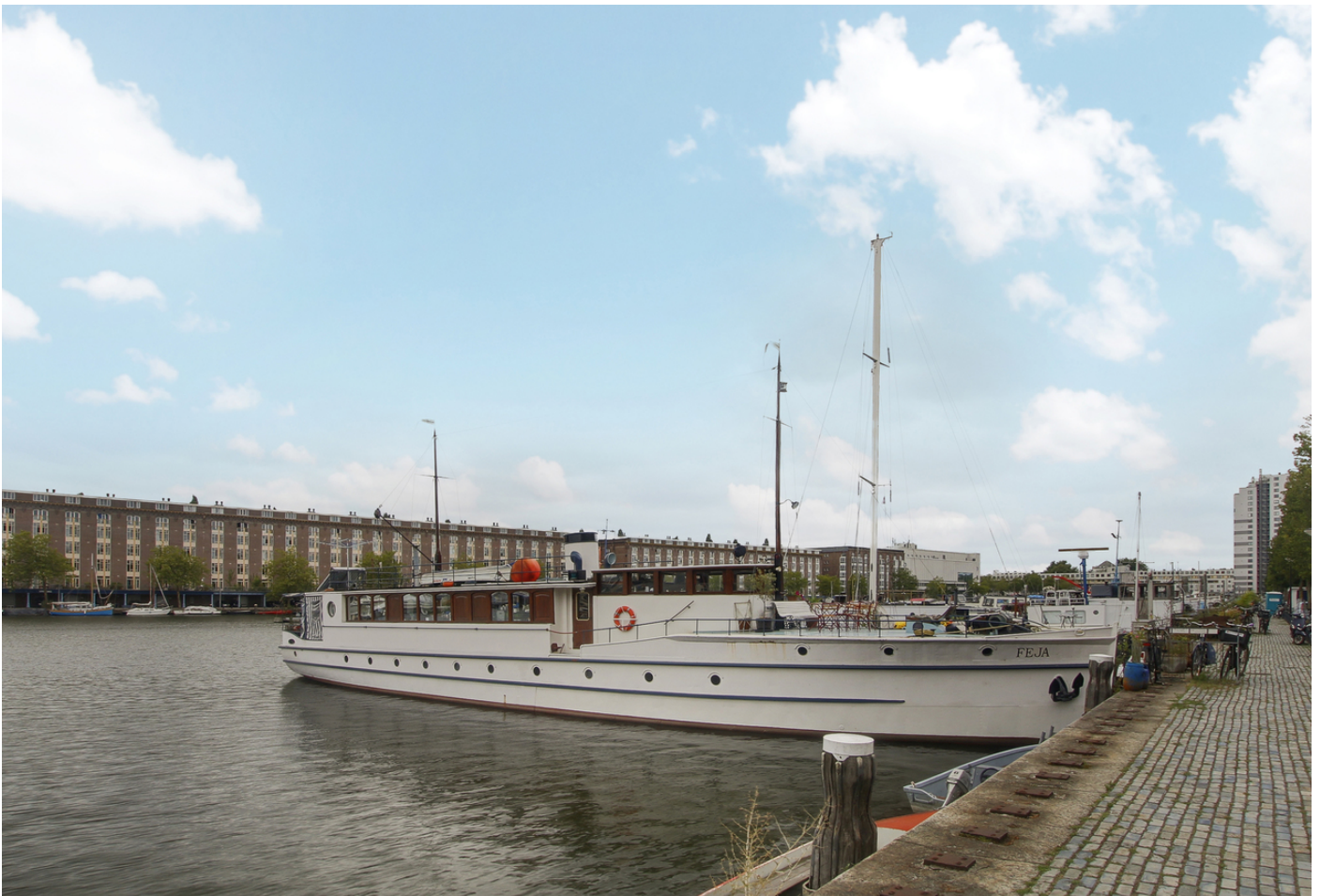
Borneokade 235, 1019 XE AMSTERDAM