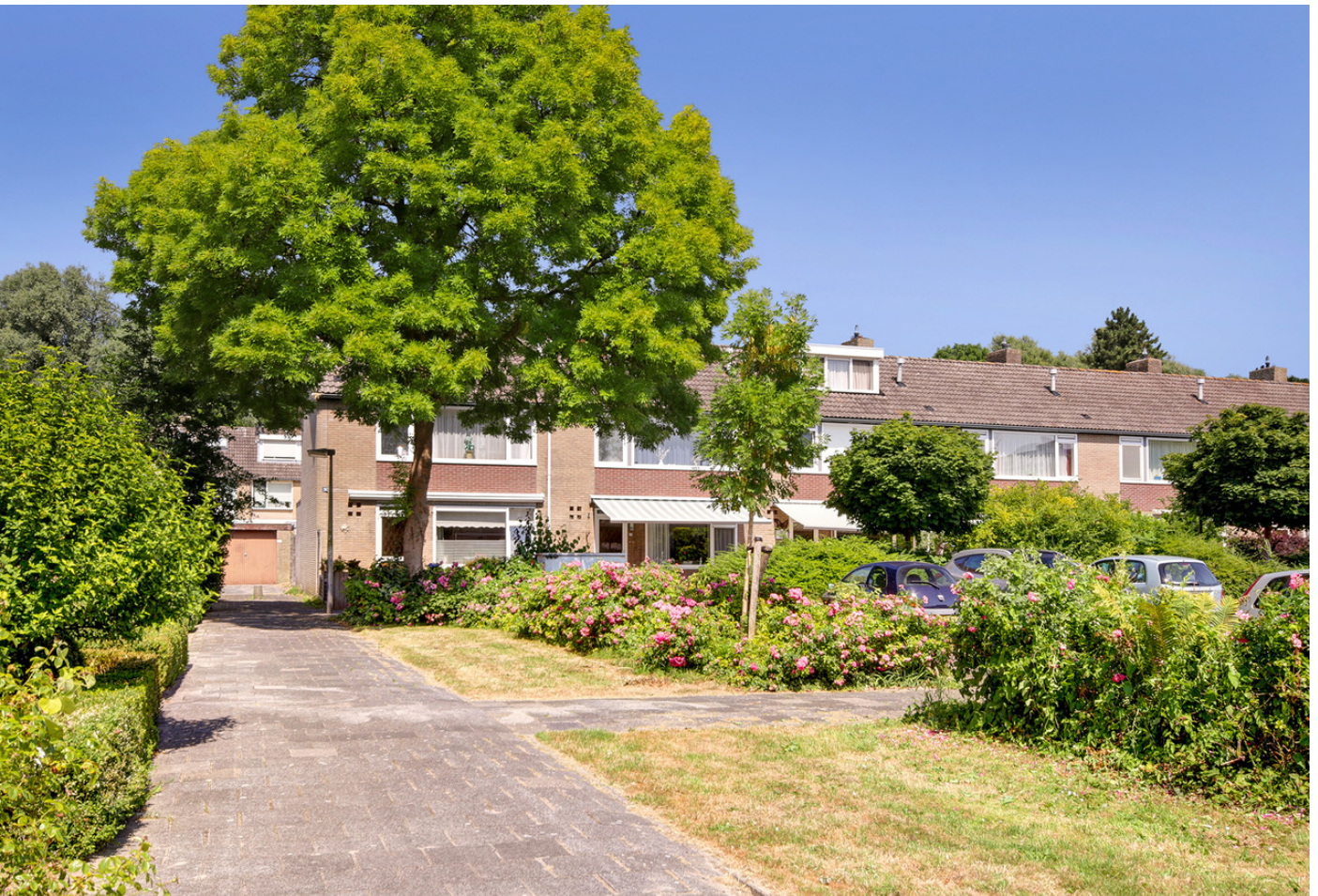
Scholeksterhof 72, 1444 AS PURMEREND