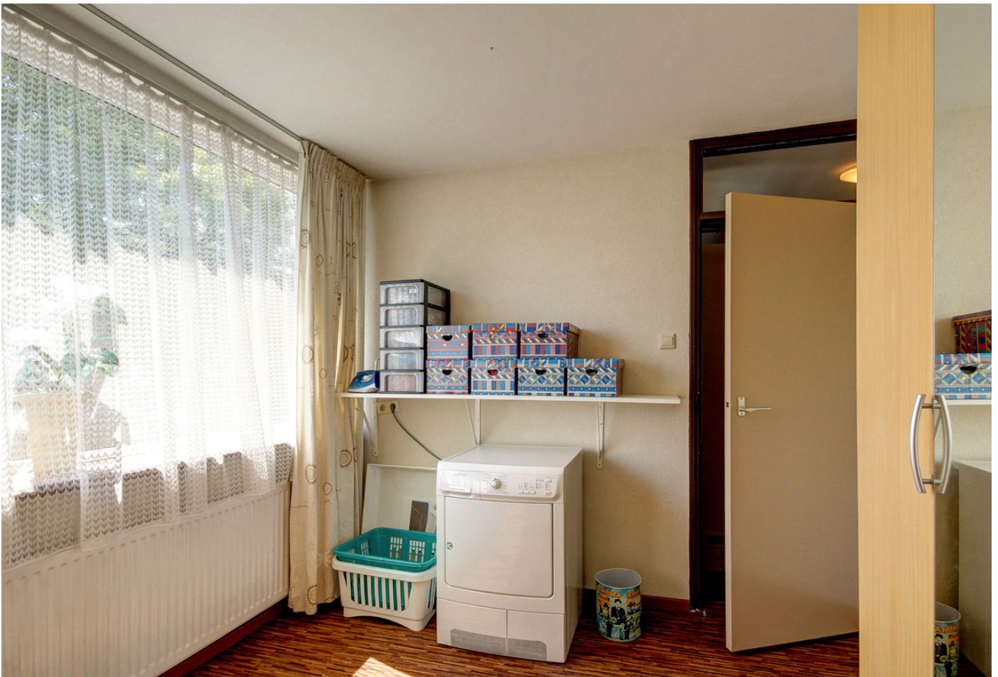
Scholeksterhof 72, 1444 AS PURMEREND