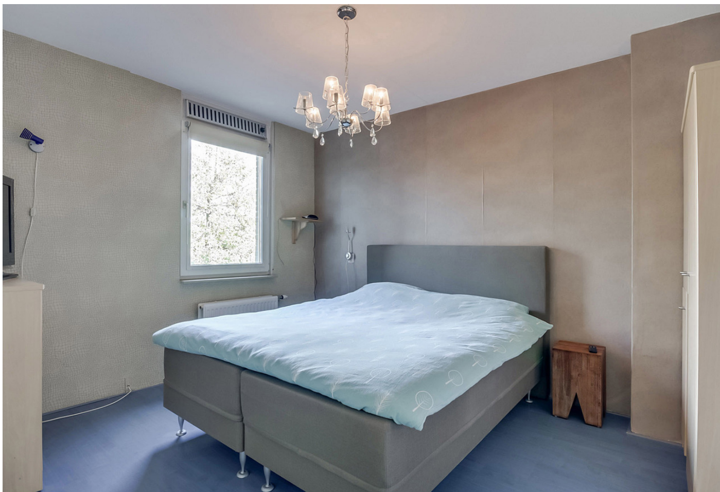
Dom H. van der Laanstraat 10, 1064 DC AMSTERDAM