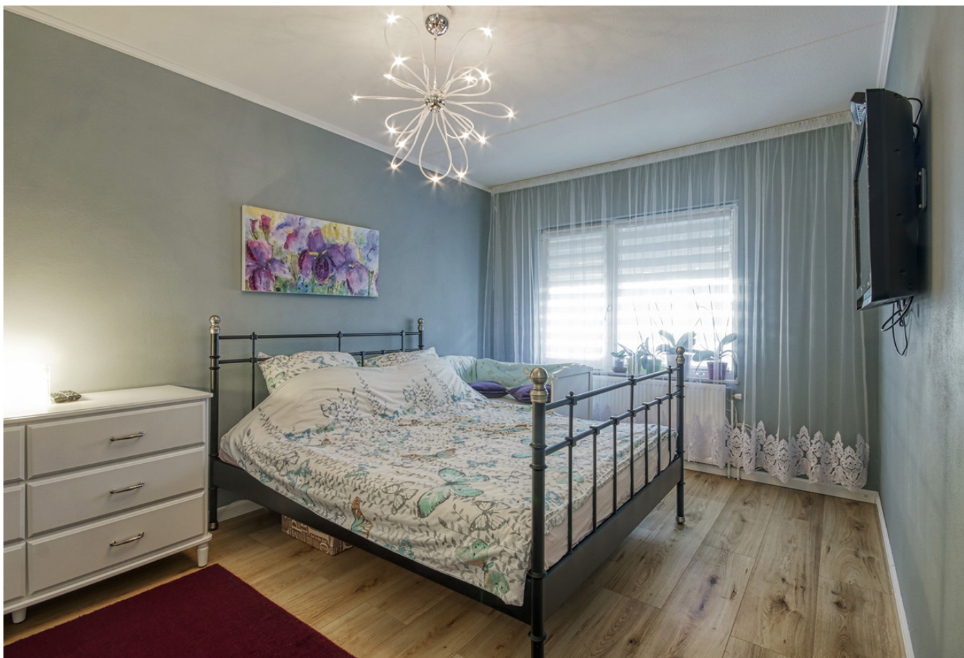
Osdorper Ban 90A23, 1068 MK AMSTERDAM