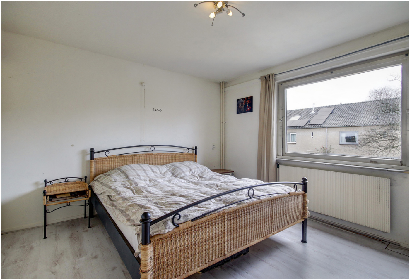
Clara Bartonstraat 5, 1025 KT AMSTERDAM