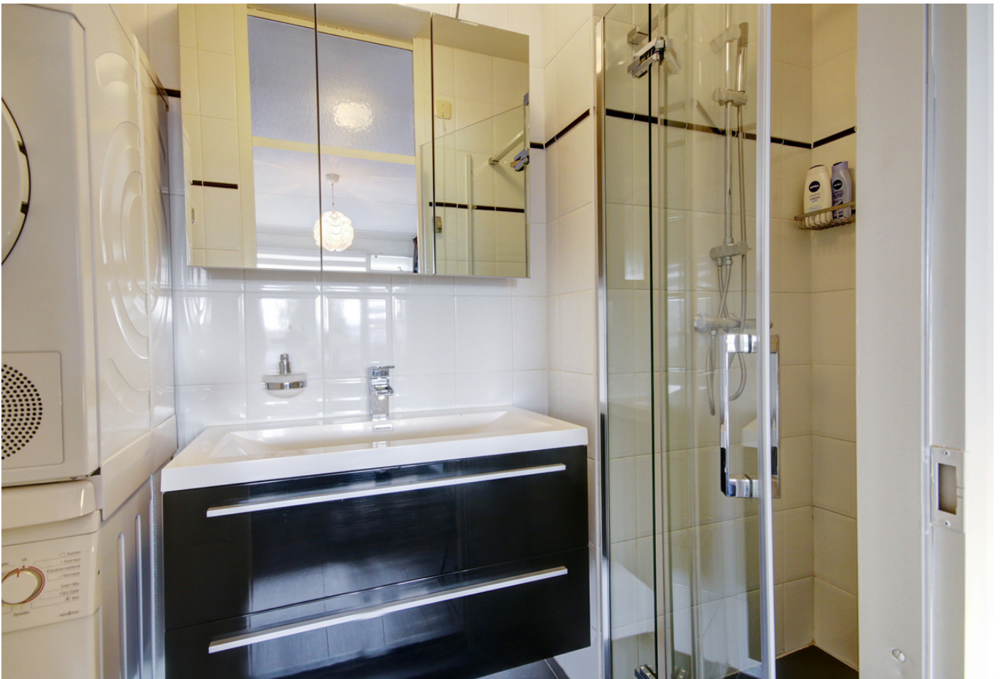
Voordorp 51, 2352 BT LEIDERDORP