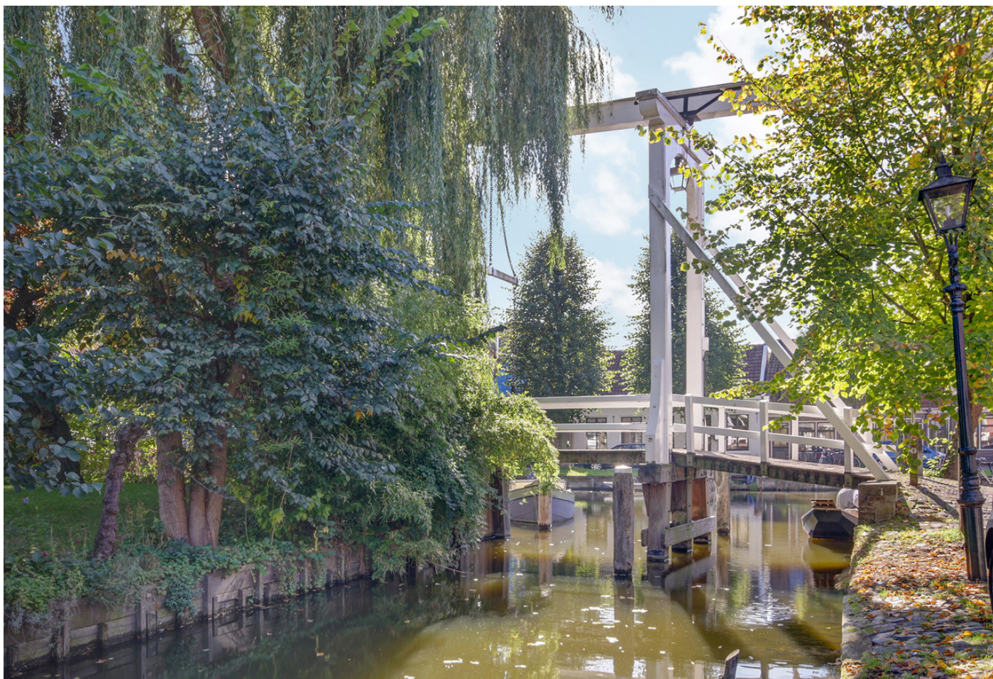
Zonepad 15, 1141 SN MONNICKENDAM