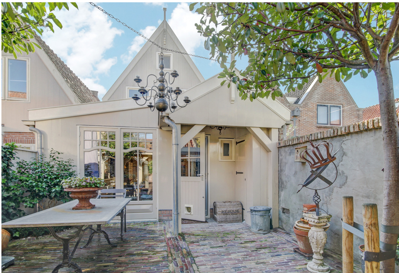
Zonnepad 15, 1141 SN MONNICKENDAM