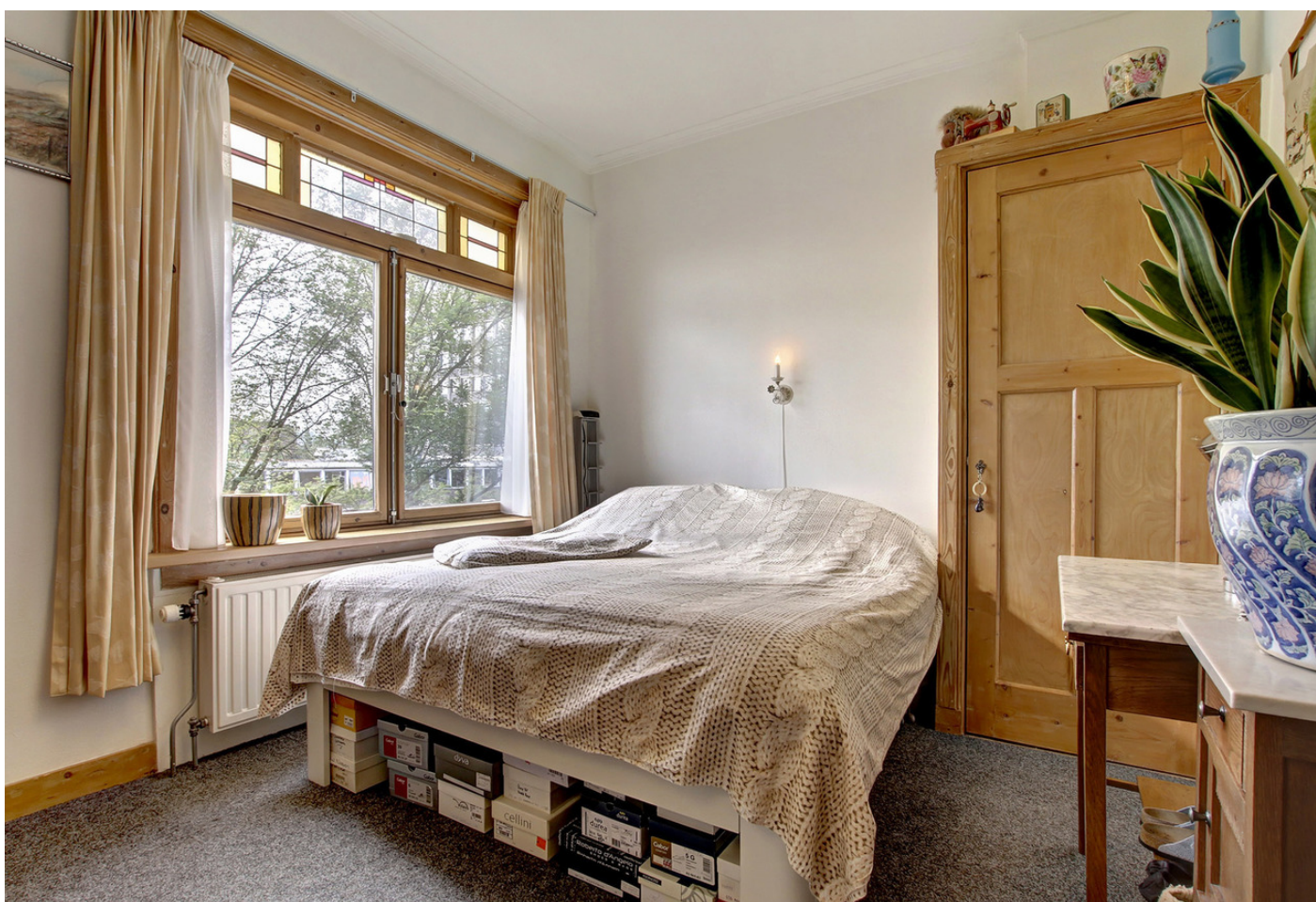
Rijnsburgstraat 18II, 1059 AV AMSTERDAM