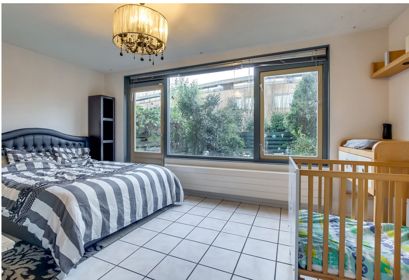
Spyridon Louisweg 112, 1034 WR AMSTERDAM