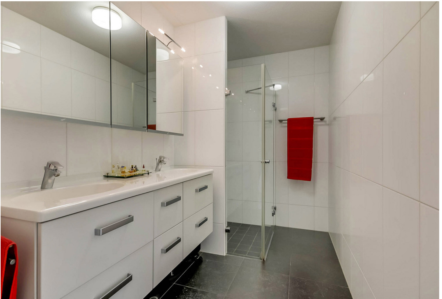
Pruimenstraat 16b, 1033 KM AMSTERDAM