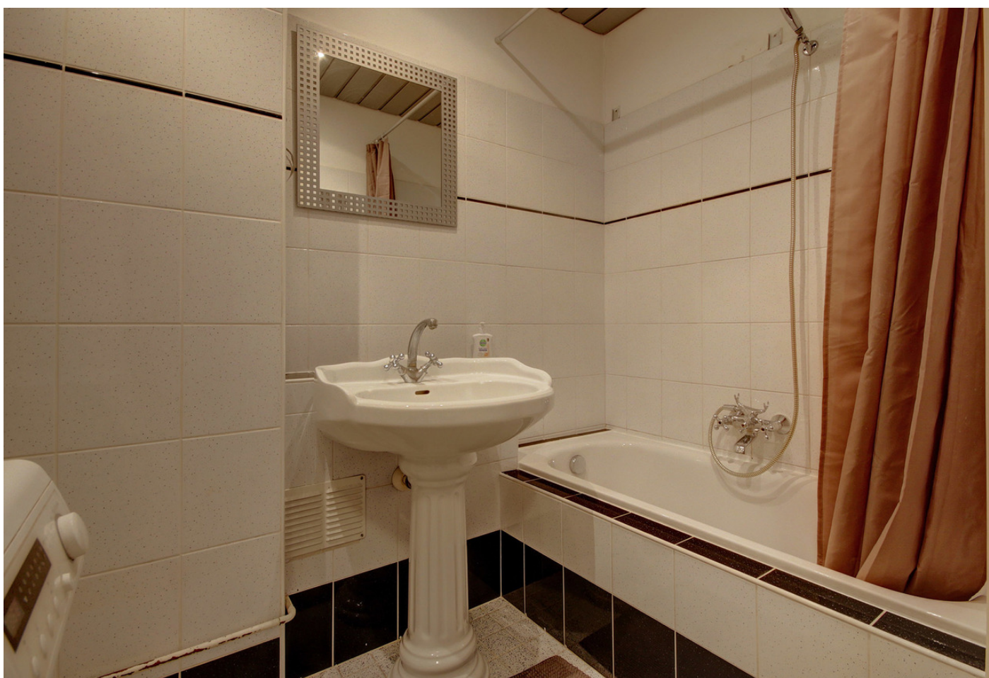
Het Breed 549, 1025 HV AMSTERDAM